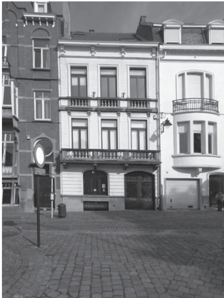
Foto: Gebouw Belgische Theosofische Vereniging in Brussel