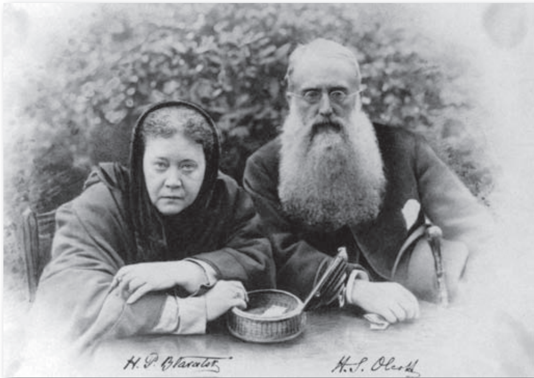
Foto: H.P. Blavatsky en H.S. Olcott

Kennis van de geschiedenis van de TS kan helpen bij het onderzoek naar de achtergronden van leringen van eeuwige wijsheid. Het is een fascinerend verhaal van groeiend geestelijk inzicht en van een groep mensen die dit met vallen en opstaan heeft getracht vorm te geven. In deze bijlage worden alleen de grote lijnen en enkele observaties weergegeven.