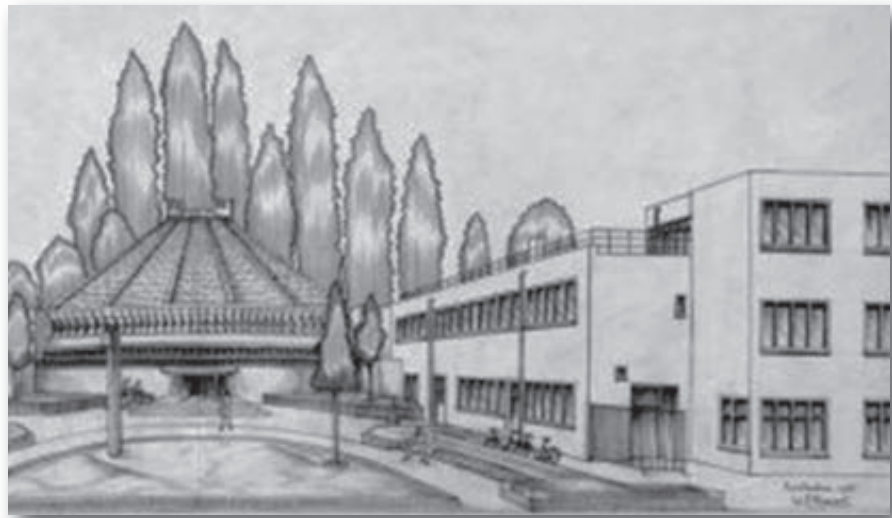
Pentekening: Links gebouw Cinetol (destijds ontworpen als theosofische tempel) en rechts het gebouw van de TVN in Amsterdam.