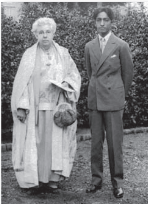
Foto: A. Besant en J. Krishnamurti

Annie Besant, de tweede International President van de TS, en de helderziende C.W. Leadbeater waren zeer actief. Samen deden ze helderziend onderzoek en dat resulteerde in een groot aantal publicaties. Ceremonieel werk werd belangrijk. The Liberal Catholic Church (Vrij-Katholieke