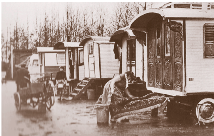
Woonwagens op een kamp. Ze zijn voorzien van mooi houtsnijwerk.

over het reizende bestaan dat we leidden. We liepen dan ook al een tijdje rond in het vlakke land achter de duinen waar de mensen de zee hadden getemd.