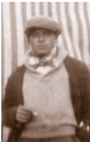
Mijn vader, ongeveer twintig jaar oud.

prachtig. Muziek is immers heilig voor de Sinti. Vaak is hij met zijn instrumenten bezig. Met een stukje glas slijpt hij laagje voor laagje het hout laagje van de klankkast. De viool wordt daardoor steeds dunner, tot het geluid onnavolgbaar mooi is.