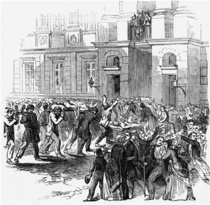
19 maart 1848: de doden van de barricadestrijd worden getoond aan de koning, die hun op het balkon zijn eer betoont.