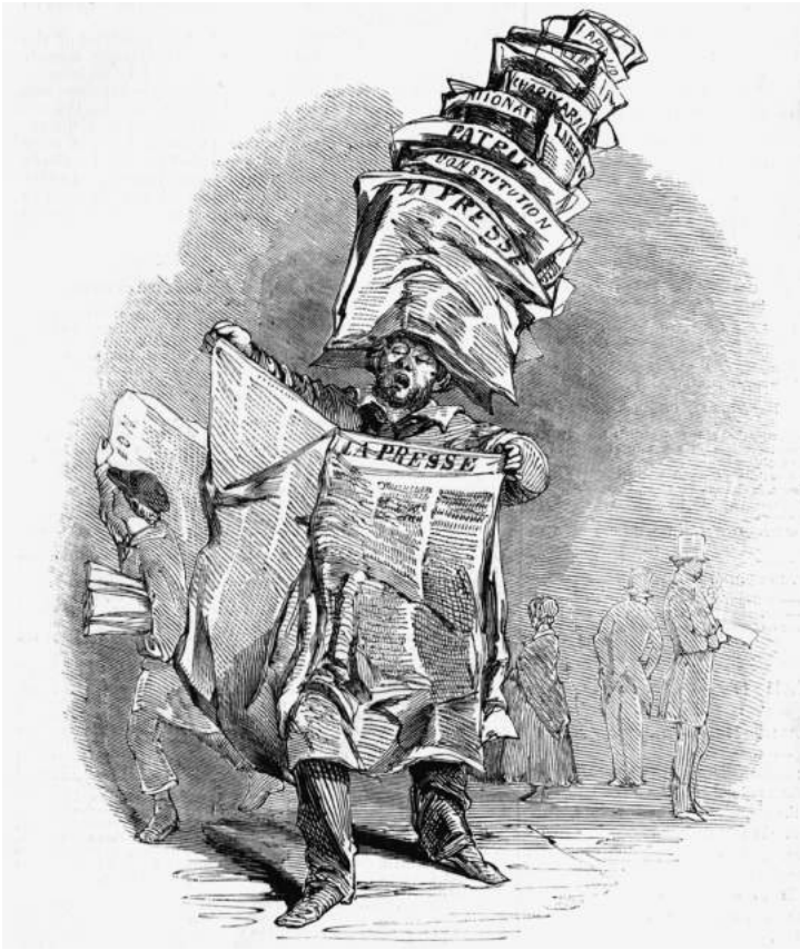
Met de Februarirevolutie van 1848 explodeerde de drukpers in Parijs.

dule welbevinden een direct gevolg moet zijn van het gemeenschappelijke. 4