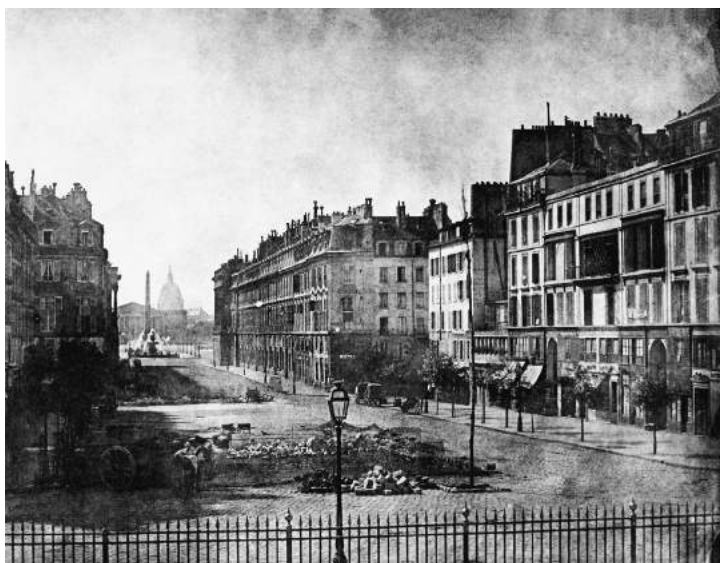
Zeldzame foto van een barricade in de Rue Royale.

pagina's dik, en voor een paar cent verkocht op straathoeken en in cafés. Ze droegen ronkende titels: La Voix du Peuple , Le Peuple Souverain , La Vraie République , Le Père Duchêne (naar de gevreesde revolutiekrant uit de jaren 1790-1794). 7 Ook kranten die vóór de revolutie ondergronds of onder strenge beperkingen waren uitgegeven bloeiden op, zoals het republikeinse La Réforme en de arbeiderskranten L'Atelier en La Fraternité . 8 Niet alleen de geletterden lazen de krant, zelfs analfabeten konden in cafés lusteren naar kranten die hardop werden voorgelezen. 9