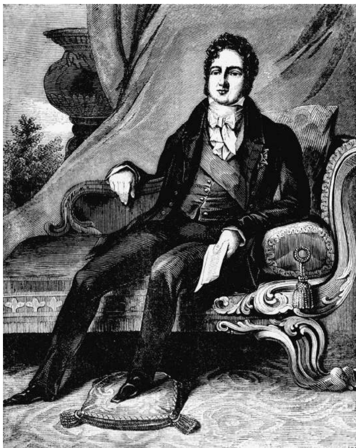
Lodewijk Filips was de laatste koning van Frankrijk.

geslaagd: de koning was verjaagd, een republiek was gesticht. Onmiddellijk riep de nieuwe regering het algemeen kiesrecht uit, schafte nu ook in de overzeese gebieden de slavernij af en kondigde ingrijpende sociale hervormingen aan. Eén daarvan was een overheidsgarantie op werkgelegenheid. In een paar weken tijd gebeurde wat een maand eerder nog onmogelijk had geleken. Tekenend zijn de woorden van een observerende intellectueel, die ondanks zijn gematigd republikeinse opvattingen werd gegrepen door de geest van de revolutie: ‘Sinds 24 februari maken wij het meest uitzonderlijke schouwspel mee dat een volk ooit heeft teweengebracht sinds het ontstaan van de we-