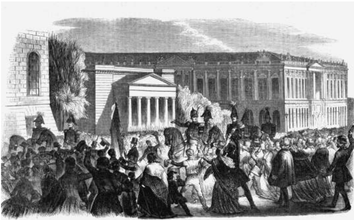
Koning Frederik Willem IV maakt daags na de revolutie een rit door de stad, om zijn verzoeningsgezindheid te tonen.