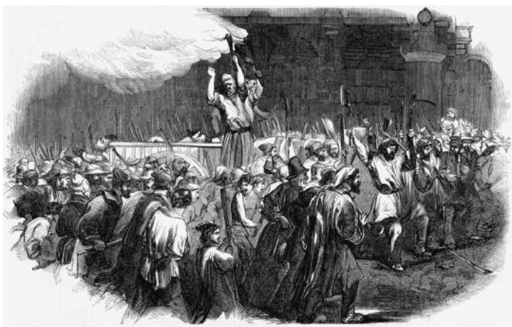
Massale optocht naar het kantoor van de revolutionaire krant Le National , onder het zingen van het lied 'Mourir pour la Patrie'.