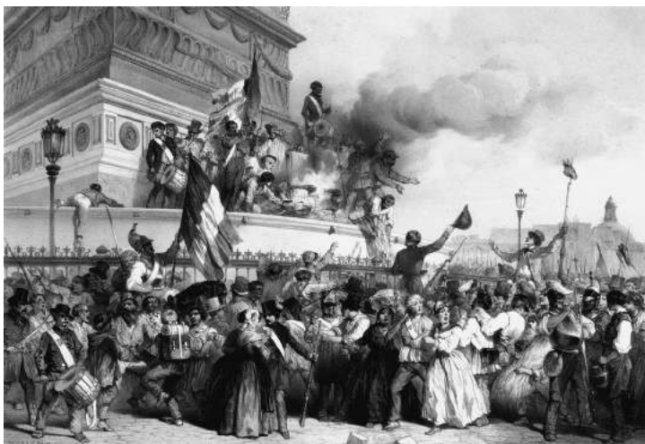
De troon van Lodewijk Filips wordt verbrand op het monument voor de Juli-revolutie (1830) op het Place de la Bastille.

reld. De pers is vrij verklaard van elke hindernis; alle Fransen, zonder uitzondering, genieten het onbeperkte recht om hun gedachten te uiten. De woorden Vrijheid, Gelijkheid, Broederschap zijn in alle openbare monumenten gekerfd en worden door alle monden nagezegd; we horen onophoudelijk en overal roepen dat burgers gelijk zijn en dat zij broeders zijn, en dat het indivi-