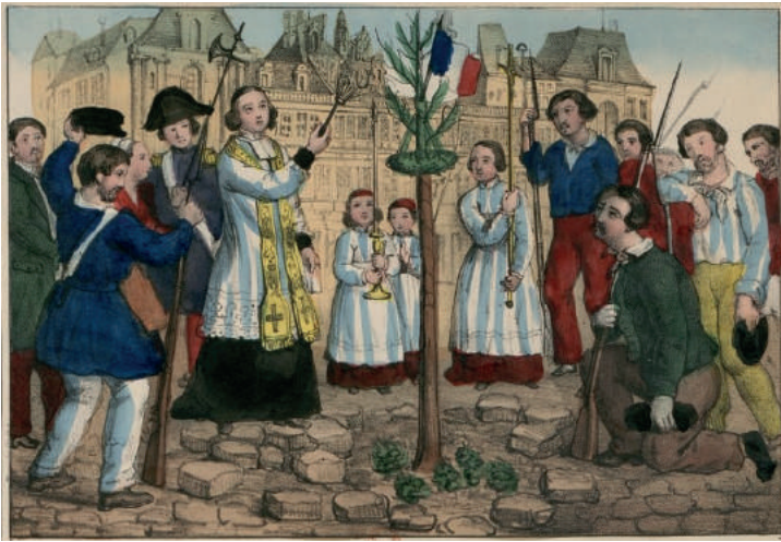
Het planten van een 'vrijheidsboom' in Parijs om de revolutie te vieren.

beginnende dichter zich geroepen een loflied te schrijven op dat arme volk op de barricade: