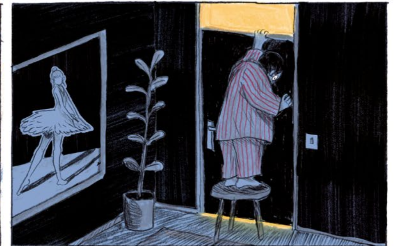
MAMSIË SLAAPT DAAR OP DE GROND. SLAPEN MOET TOCH IN BED!