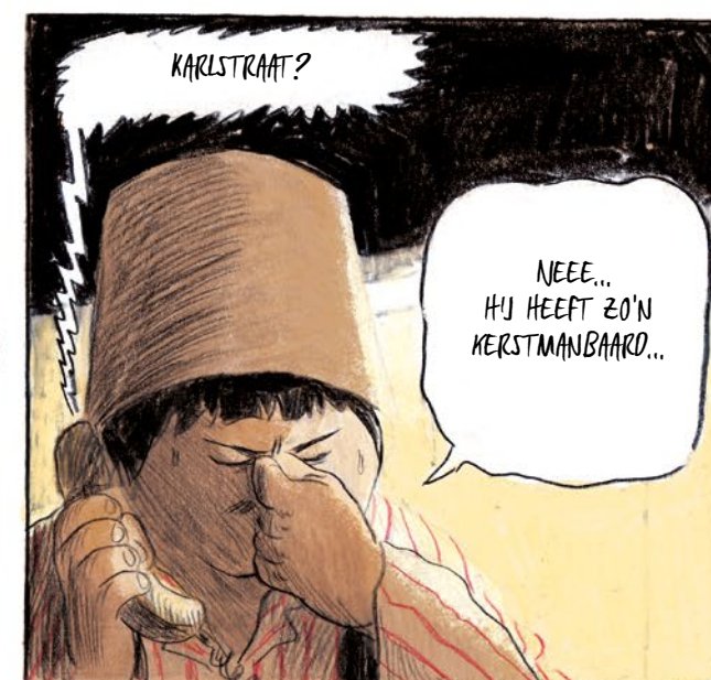
KARLSTRAAT? NEË... HIJ HEËT ZO'N KERSTMANBAARD...