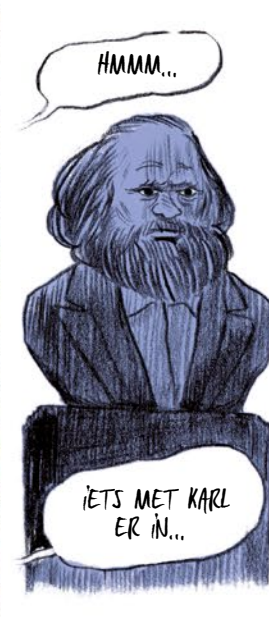
HMM... IETS MET KARL ER IN...