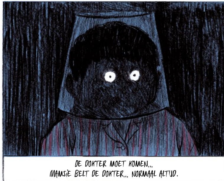
DE DOKTER MOET KOMEN... MAMSIË BELT DE DOKTER... NORMAAL ALTJD.