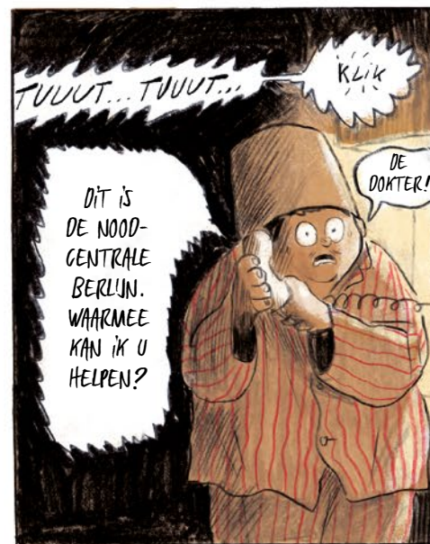
TUUUT... TUUT... KLIK DE DOKTER! DIT IS DE NOOD-CENTRALE BERLIN. WAARMEE KAN IK U HELPEN?