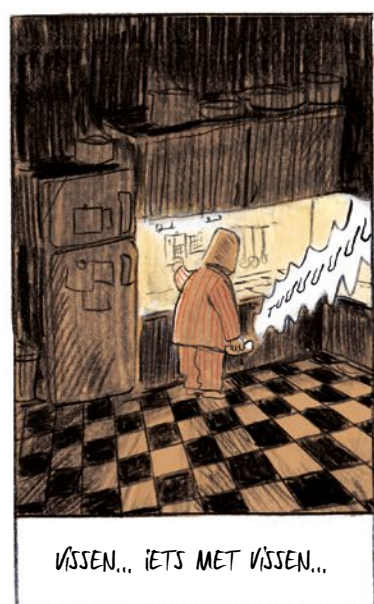
VISSEN... IETS MET VISSEN...