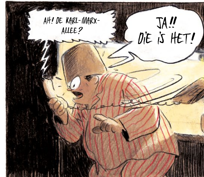
AH! DE KARL-MARX-ALLEE? JA!! DIE IS HET!