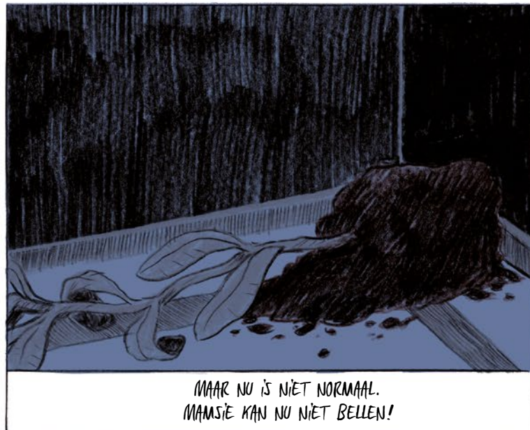
MAAR NU IS NIET NORMAAL. MAMSIË KAN NU NIET BELLEN!