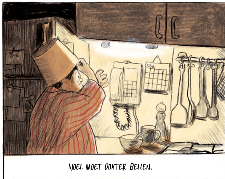
NOEL MOET DOKTER BELLEN.