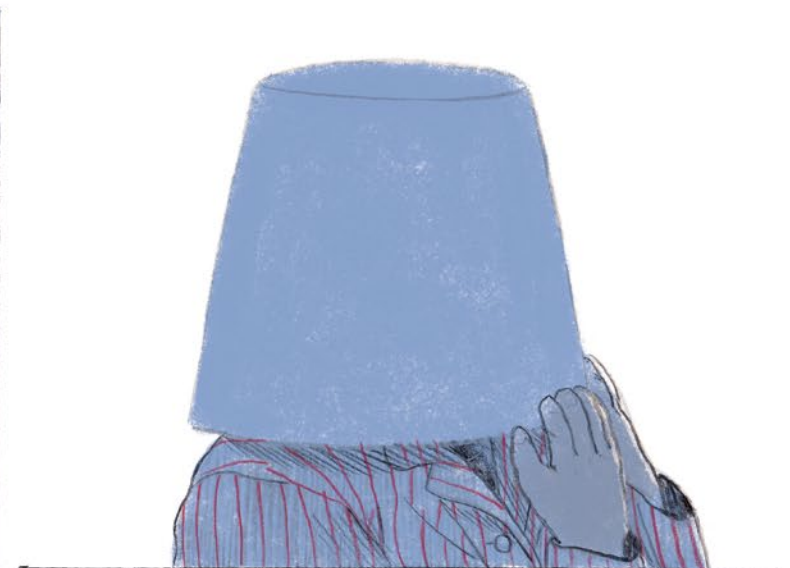
NADENKEN... MOET NADENKEN...