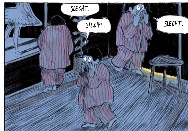
EN BLOED... 'S OOK BLOED... BLOED OP DE VLOER... HOORT DAAR NIË.