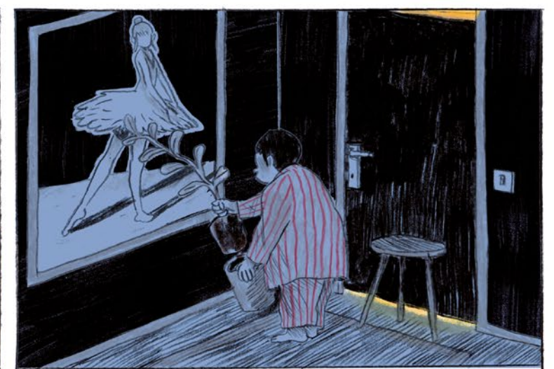
STOP. MOET RUSTIG WORDEN.