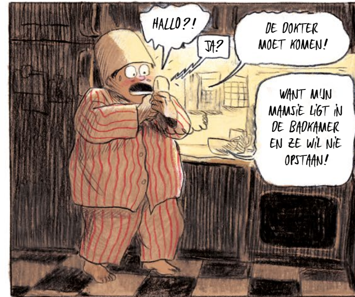
HALLO?! JA? DE DOKTER MOET KOMEN! WANT MIJN MAMSIË LIGT IN DE BADKAMER EN ZE WIL NIË OPSTAAN!