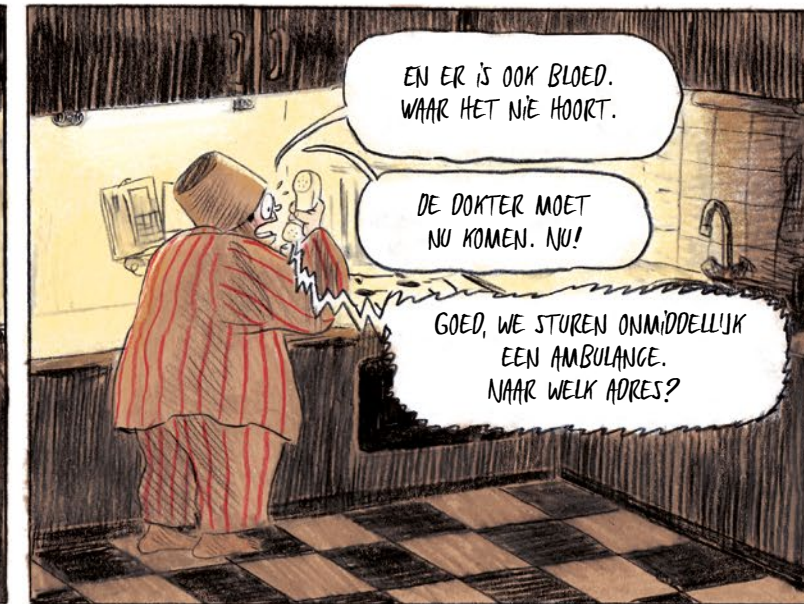
EN ER IS OOK BLOED. WAAR HET NIË HOORT. DE DOKTER MOET NU KOMEN. NU! GOED, WE STUREN ONMIDDELIJK EEN AMBULANCE. NAAR WELK ADRES?