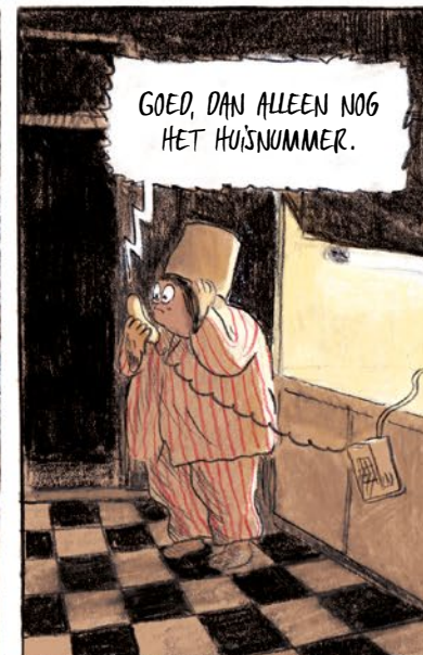
GOED, DAN ALLEEN NOG HET HUISNUMMER.