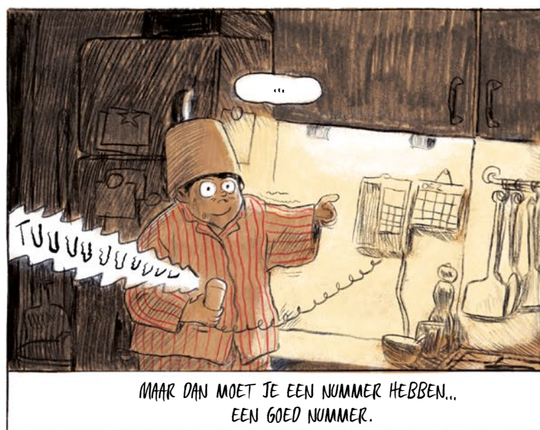
... TUUUUUUUUUUU MAAR DAN MOET JE EEN NUMMER HEBBEN... EEN GOED NUMMER.