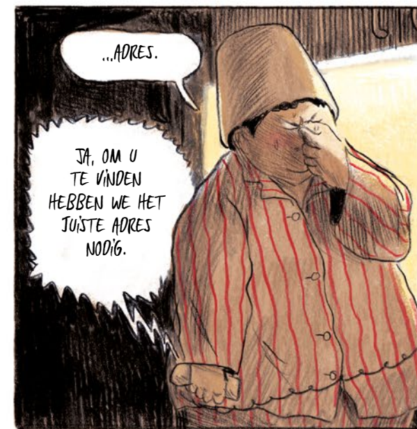
...ADRES. JA, OM U TE VINDEN HEBBEN WE HET JUSTE ADRES NODIG.