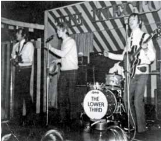
David Bowie (vlak na zijn naams- wijziging) en The Lower Third.