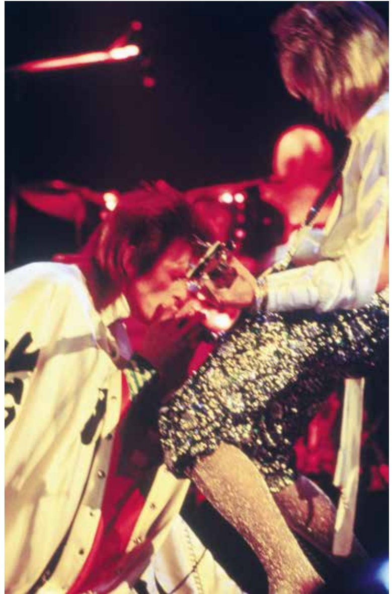
In een innige pose op het podium met Mick Ronson en zijn gitaar.