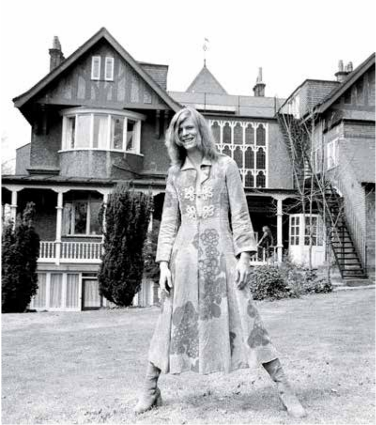
Bowie in een jurk voor Haddon Hall, het huis waar hij met Angie woonde.