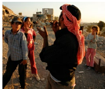
Geitenhoeders bij Umm Qays.

De afstanden in Jordanië zijn niet al te groot; zelfs in een week kunt u erg veel zien. Er is echter meer dan genoeg om een langer verblijf te rechtvaardigen. Zo kunt u alleen al in Petra gemakkelijk vier dagen doorbrengen. Daarnaast kunt u genieten van de warme bronnen van Hammamat Ma'in, een kuur met modderbaden volgen aan de Dode Zee of een bezoek brengen aan beroemde bijbelse plaatsen. Ook wie niet gelovig is, zal onder de indruk raken van het uitzicht vanaf de Jabal Nibu (berg Nebo), waar Mozes uitkeek op het Beloofde Land. Jordanië mag dan niet groot zijn, het heeft de bezoeker ongelooflijk veel te bieden.