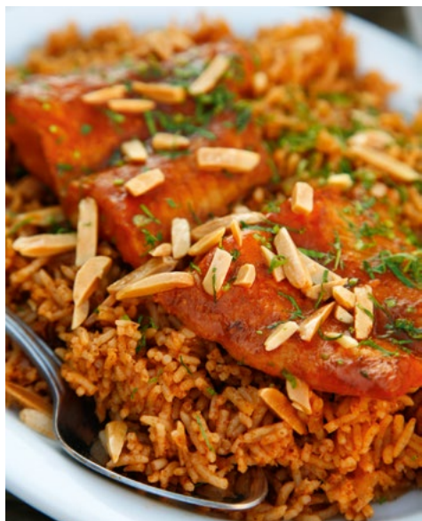
Proef in Aqaba sayadiya, een befaamde visschotel.

Net als de inwoners van andere Midden-Oosterse landen zijn de Jordaniërs echte zoetekauwen. Zoete lekkernijen, zelfgemaakt of gekocht, worden bij elke gelegenheid tevoorschijn gehaald. Ze zijn met name populair aan het eind van de ramadan, bij islamitische en christelijke feesten en bij trouwerijen. Een kijkje in een patisserie, met een overdaad aan prachtig uitgesteld gebak en andere zoetheiden, is beslist de moeite waard. Overal in het Midden-Oosten is baklava - lagen filodeeg, gevuld met gehakte noten en ge-