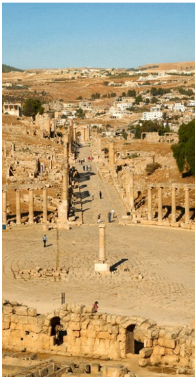
Het ovale forum, Jarash.