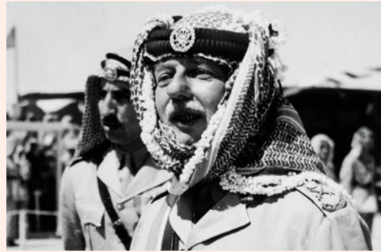
Generaal John Bagot Glubb, de oprichter van de woestijnpatrouille, in de jaren vijftig.

Ingrijpende veranderingen kondigden zich in de regio aan. Het Arabische nationalisme, aangewakkerd door president Gamal Abdel Nasser van Egypte,