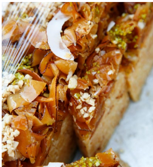
Baklava, het populairste nagerecht.

Thee en koffie komen meteen na de maaltijd op tafel. Vooral rond koffie is een complete subcultuur ontstaan (zie blz. 158).