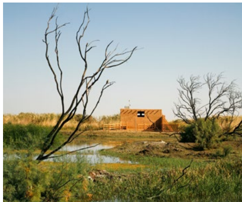
De wetlands van Azraq.

Bezoek net zoals Lawrence het kasteel van Azraq en rijd op een kameel door het magische landschap van Wadi Rum. Zie blz. 277 en 246.