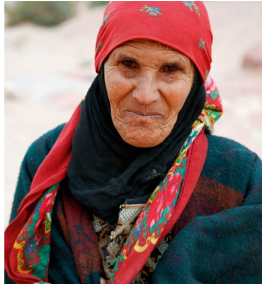
Bedoeïenenvrouw bij Petra.

Nomadische bedoeïenen trekken voortdurend van de ene plek naar de andere, op zoek naar wei-