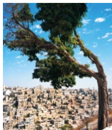
Uitzicht op Amman vanaf de Citadel.

Een gedetailleerde gids van het hele land, waarbij de belangrijkste bestemmingen met een cijfer (of letter) zijn aangegeven op de kaartjes (bijvoorbeeld 1).