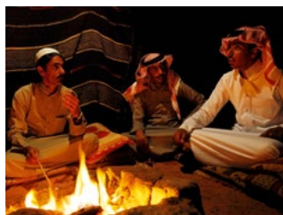
Bedoeïenen bij hun kampvuur in Wadi Rum.

Jordanië staat niet alleen bekend om zijn adembenemend mooie woestijnlandschappen en gastvrije bevolking, maar ook om de ongerepte koraalriffen van de Rode Zee en de magnifieke monumenten uit de Oudheid.