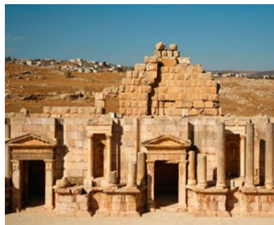
Het zuidelijke theater in Jarash.

De uitgestrekte, dunbevolkte woestijn in het binnenland, die zich in oostelijke en zuidelijke richting uitstrekt, vormt een groot contrast met de concentratie culturele bezienswaardigheden in en rond de Jordaanvallei. Dit