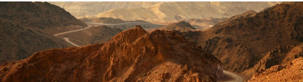
De weg van Klein-Petra naar Wadi Arabah.