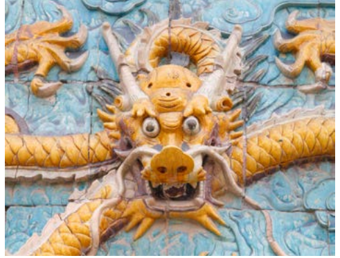
Detail van het Negendrakenscherm in de Verboden Stad in Beijing.