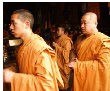
Boeddhistische monniken op de heilige Wutai Shan.

Sinds het eind van de Tweede Wereldoorlog is de bevolking van China meer dan verdubbeld, tot 1,38 miljard inwoners. Hoewel slechts 7 procent van het grondgebied geschikt is voor landbouw, moet hiermee een vijfde van de wereldbevolking worden gevoed. Ook het scheppen van voldoende werkgelegenheid voor zoveel mensen kost de regering heel wat hoofdbre-