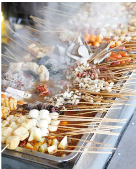
Allerlei soorten spiesjes bij een kraampje op straat.

Wie Beijing bezoekt mag een maaltijd met pekingeend niet overslaan. Nadat de eend geslacht is wordt er lucht tussen het vel en het vlees gepompt, waarna het vel met een mengsel van honing, water en azijn wordt gelakt. Daarna wordt de eend gedroogd en in een speciale oven geroosterd. Het knapperige vel wordt in dunne tarwepannekoekjes gevouwen, die met een zoete zwarte saus worden bestreken. Lente-uitjes zorgen voor een frisse, kleurige toets. Na deze gang wordt het vlees opgediend, waarna men de maaltijd kan afsluiten met eendensoep.