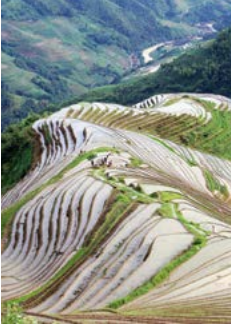
Rijstterrassen bij Longsheng, Guangxi.

Guilin-regio. De befaamde karstheuvelds langs de Li Jiang ten zuiden van Guilin behoren tot de mooiste landschappen van China. Zie blz. 342.