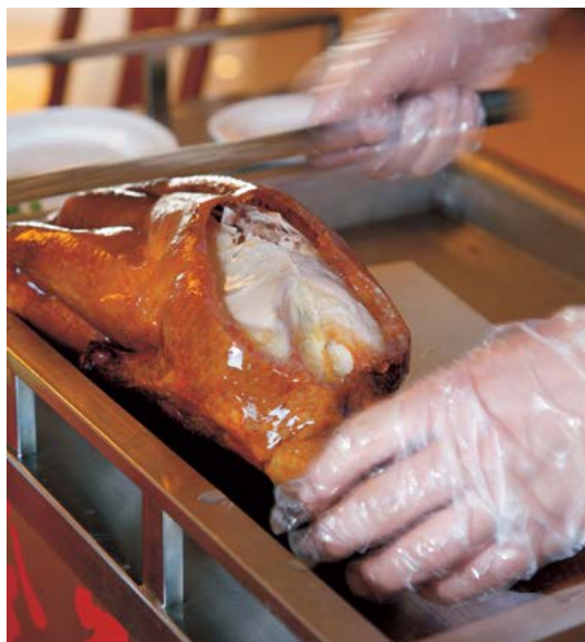
De bereiding van pekingeend is een ingewikkelde procedure die veel tijd vergt.

voedingsmiddelen, zoals koffie, vlees en pittige gerechten, geven inwendige hitte, maar overmatige hitte kan leiden tot klachten als maagzuur, huiduitslag, een koortslip of slechte adem. 'Warme' voedingsmiddelen zijn populair bij koud weer. Zo eet men in sommige delen van China in de winter graag slangenvlees, dat versterkend zou zijn. 'Koud' voedsel kan overmatige inwendige hitte tegengaan. Groenten die weinig calorieën bevatten, zoals waterkers, bitterkomkommer en witte rammenas ( daikon ), evenals de meeste vruchten, worden als 'verkoelend' beschouwd.