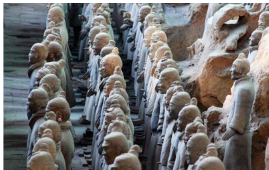
Soldaten van het Terracottaleger bij Xi'an.