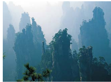
Het Wulingyuan-reservaat in de provincie Hunan.

Aan de kust van Zuid-China liggen de grote industriële en commerciële centra Guangzhou (Kanton) en Hongkong, terwijl het binnenland het woongebied van verschillende minderheden vormt en schitterende landschappen biedt, vooral rond Guilin in de provincie Guangxi. De provincie Yunnan, in het zuidwesten, is een bedwelmend geheel van hoge bergen, tropisch laagland en eeuwenoude steden. Het westen is een compleet andere wereld. Een reis door het lege landschap van Tibet en Xinjiang (Sinkiang), de regio van de historische Zijderoute, is een waar avontuur. □