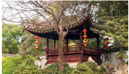
Een klassieke Chinese tuin in Suzhou.

Hongkong. Uniek, bruisend en afwisselend. Een perfecte kennismaking met China. Zie blz. 281.