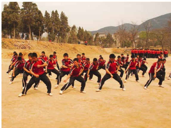
Vechtsporttraining bij de Shaolin Si.

Boottocht op de Li Jiang. Een rustige tocht door een betoverend landschap. Zie blz. 348. Dayan Ta (Grote Wilde Gans-pagode), Xi'an. Een van de imposantste pagodes in China, uit de 7e eeuw. Zie blz. 190.