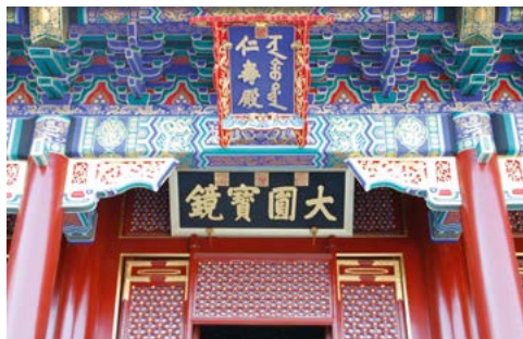
De Hal van Welwillendheid en een Lang Leven in het Nieuwe Zomerpaleis in Beijing.