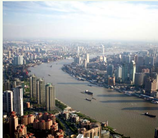
Over veel steden hangt een zware sluier van smog.

De Chinese milieuproblemen gaan de hele wereld aan. China heeft de hoogste kooldioxide-uitstoot ter wereld. Het Westen wil dat China consequenties verbindt aan zijn economische groei, maar de Communistische Partij duldt geen inmenging van