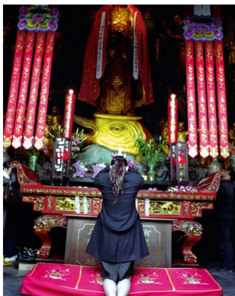
Vrouw in de Tempel van de Jaden Boedha, Shanghai.

Naast de geïstitutionaliseerde geloven nemen de meeste Chinezen bijgeloof ook zeer serieus. Het idee van de lotsbestemming stamt uit de tijd van de feodale maatschappij, toen men geloofde dat de 'god' - de keizer - ieders lot bepaalde. Onder de Tang (618-907) en de Song (960-1279) werd de samenleving zo complex dat mensen steeds vaker over hun lotsbestemming te rade gingen bij waarzeggers.