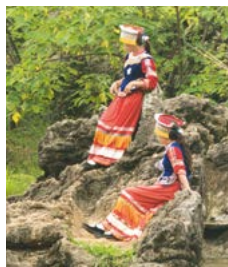
Vrouwen van het Buyi-volk in Yunnan.

Na vierduizend jaar in zichzelf gekeerd te zijn geweest, is China nu een van de supermachten die de toekomst van de wereld zullen bepalen.