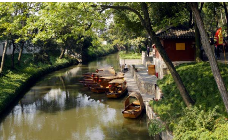
Vredig tafereel in Suzhou.

Confucius-tempel (Kong Miao), Qufu. De belangrijkste confucianistische tempel van het land. Zie blz. 184.