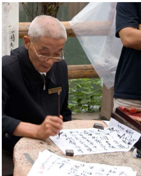
Een traditionele kalligraaf in Fenghuang.

In China zijn de schilderkunst en de kalligrafie altijd nauw verweven geweest. Chinese woorden zijn van oorsprong pictogrammen. Hoewel beide kunstvormen zich elk in een andere richting hebben ontwikkeld, bestaan er nog veel dwarsverbanden. Klassieke Chinese schilders hebben