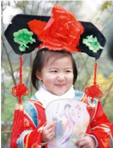
Meisje in feestkledij in een park in Beijing.

Een gedetailleerde gids van het hele land, waarbij de belangrijkste bestemmingen met een cijfer (of letter) zijn aangegeven op de kaartjes (bijvoorbeeld 1 ).