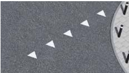
Haaiantanden op het wegdek.

Bij bord B6 zijn op het wegdek ook veelal haaiantanden aangebracht. Haaiantanden zijn voorrangsdriehoeken op het wegdek.