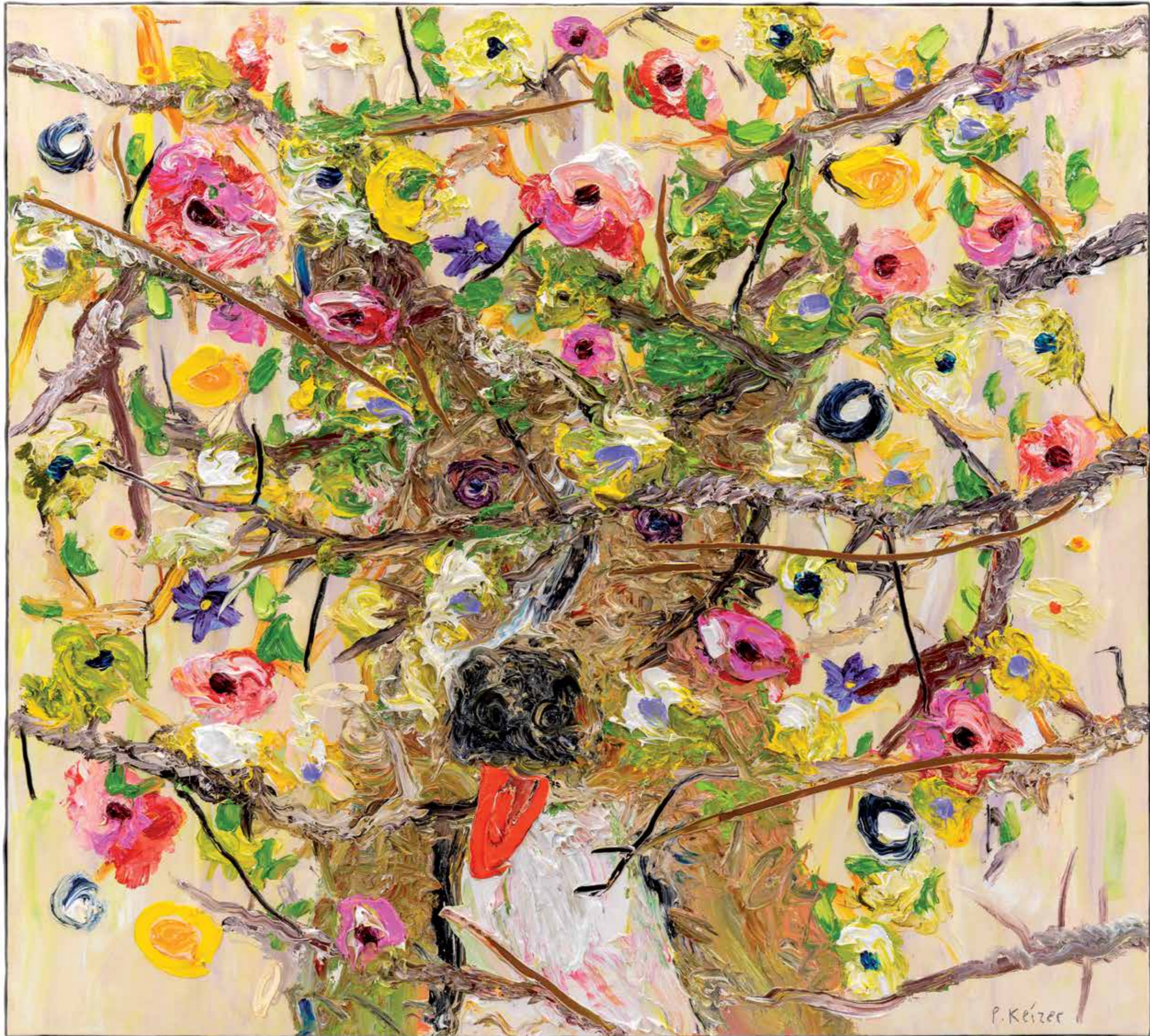
Bello, 2019 112 x 124 cm (private collection)