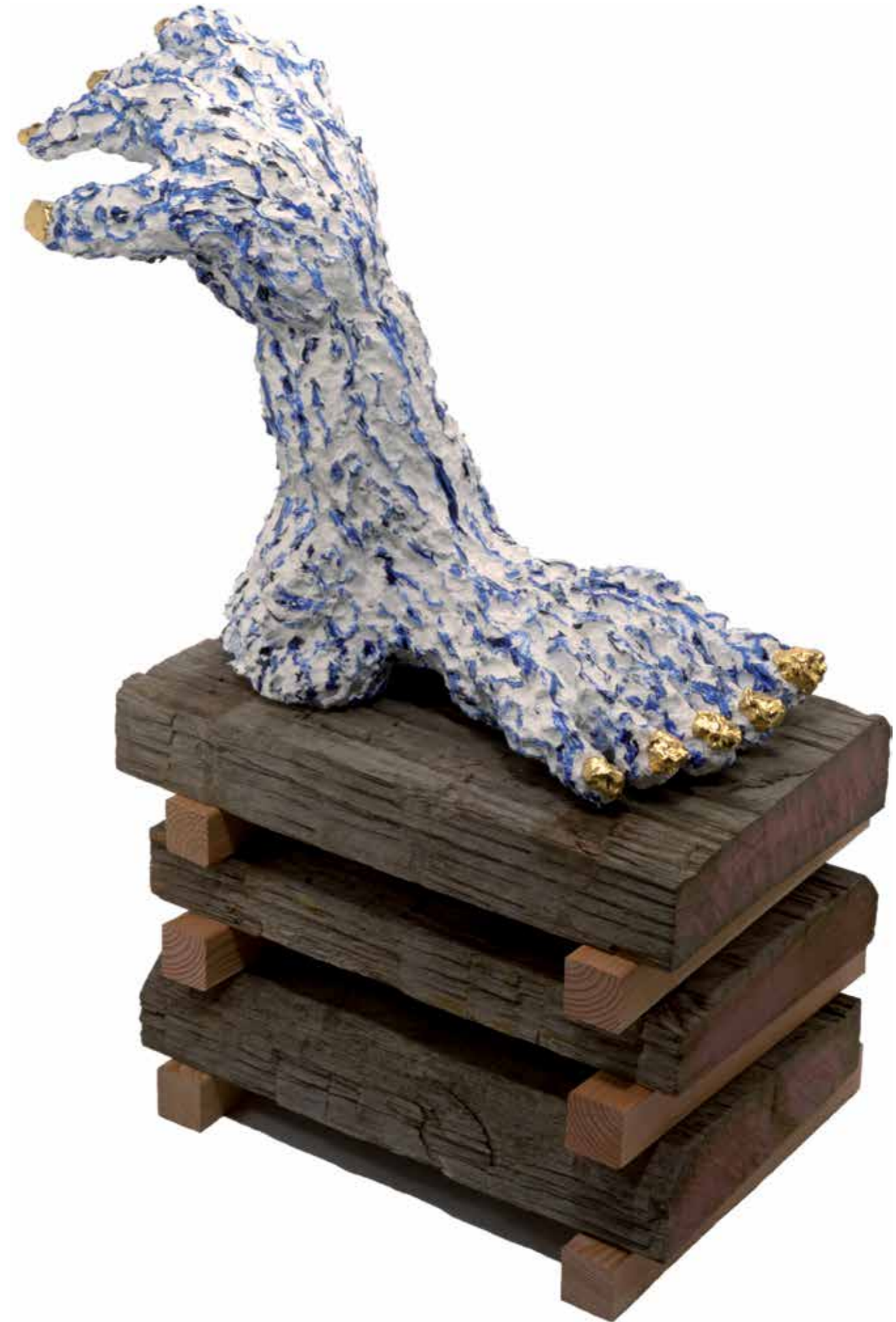
Handstand, 2018 painted ceramic, 70 × 75 × 35 cm (collection Sculpture Gallery Het Depot)