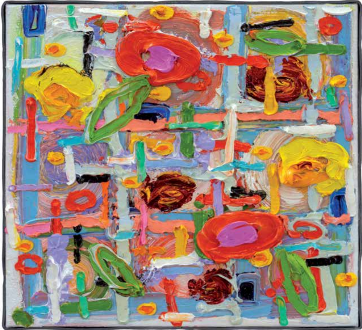
De weg op, 2017 26 x 29 cm (private collection)