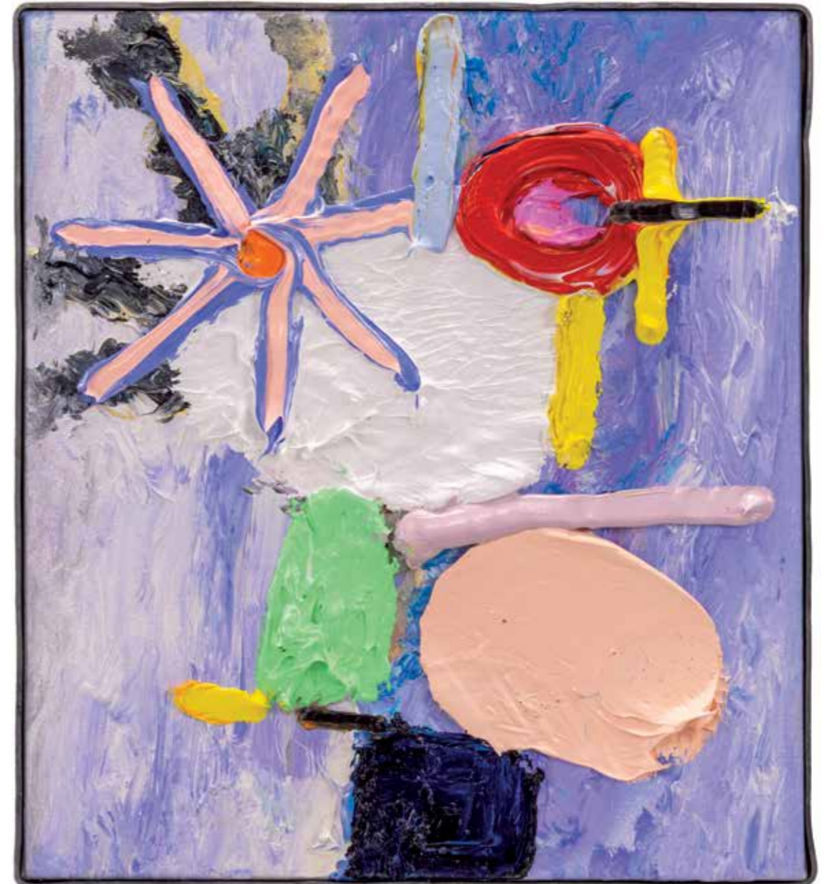
Met het licht op, 2019 29 x 26 cm