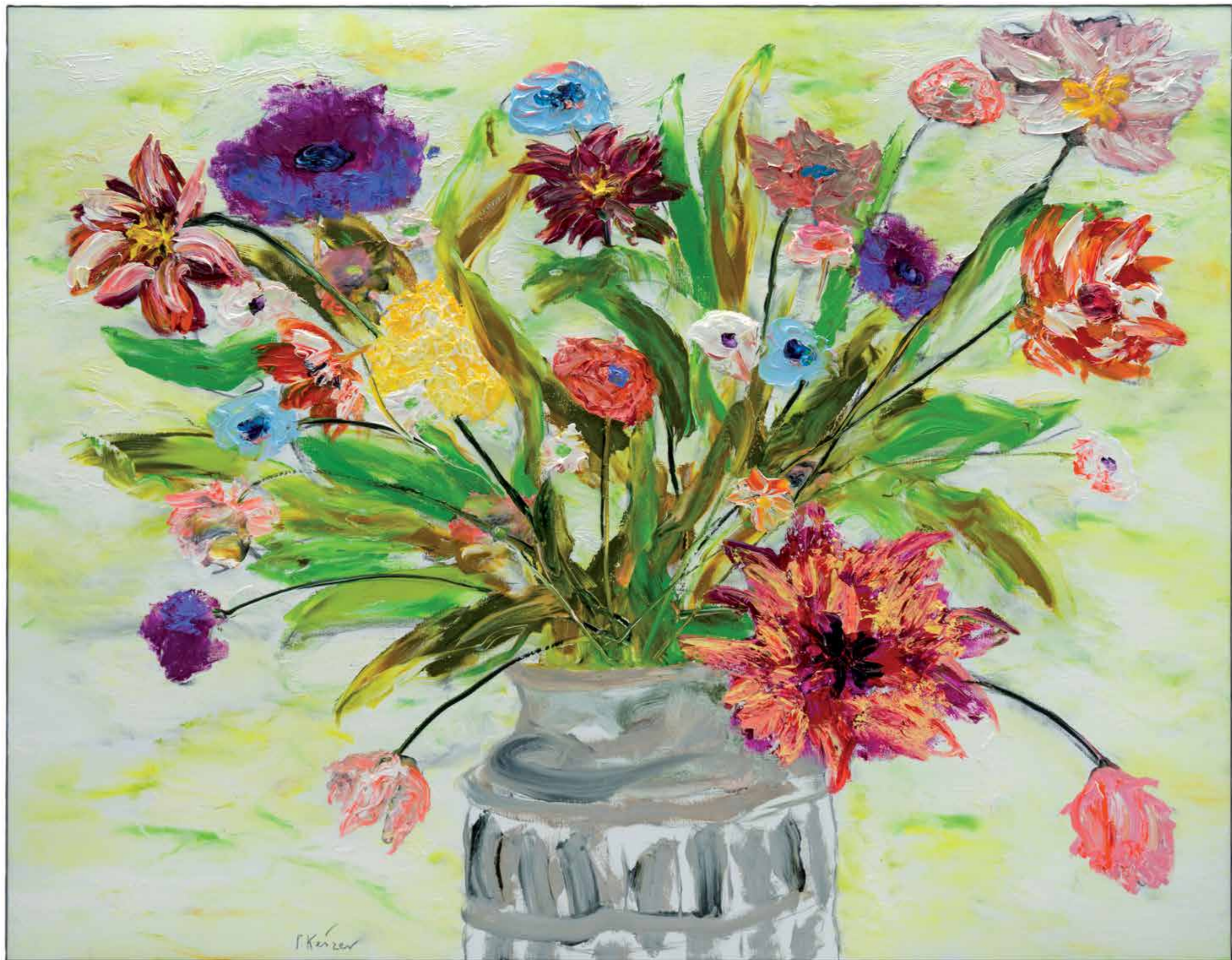
Voor altijd vers, 2015 166 x 212 cm