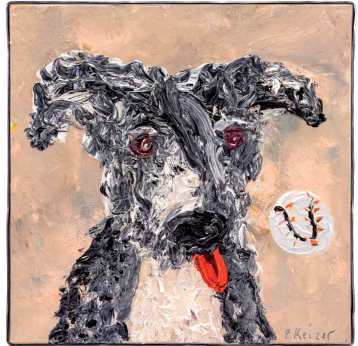
Kwartiertje tijd, 2019 40 x 40 cm