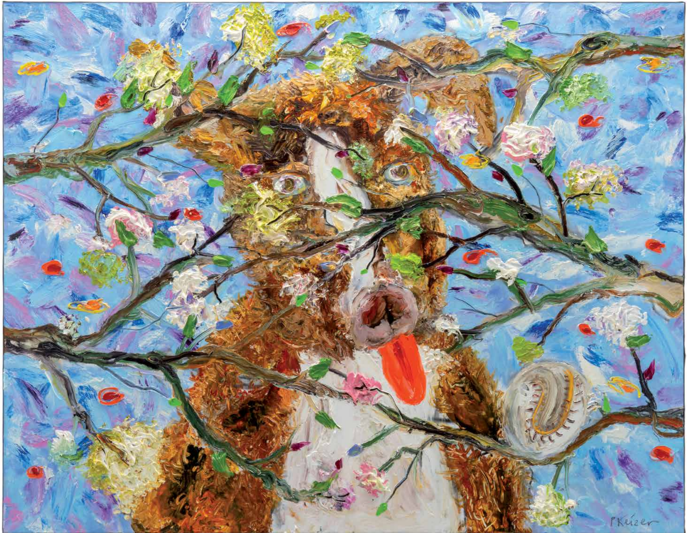
Ik ben een mazzelpik, 2015 166 × 212 cm (private collection)