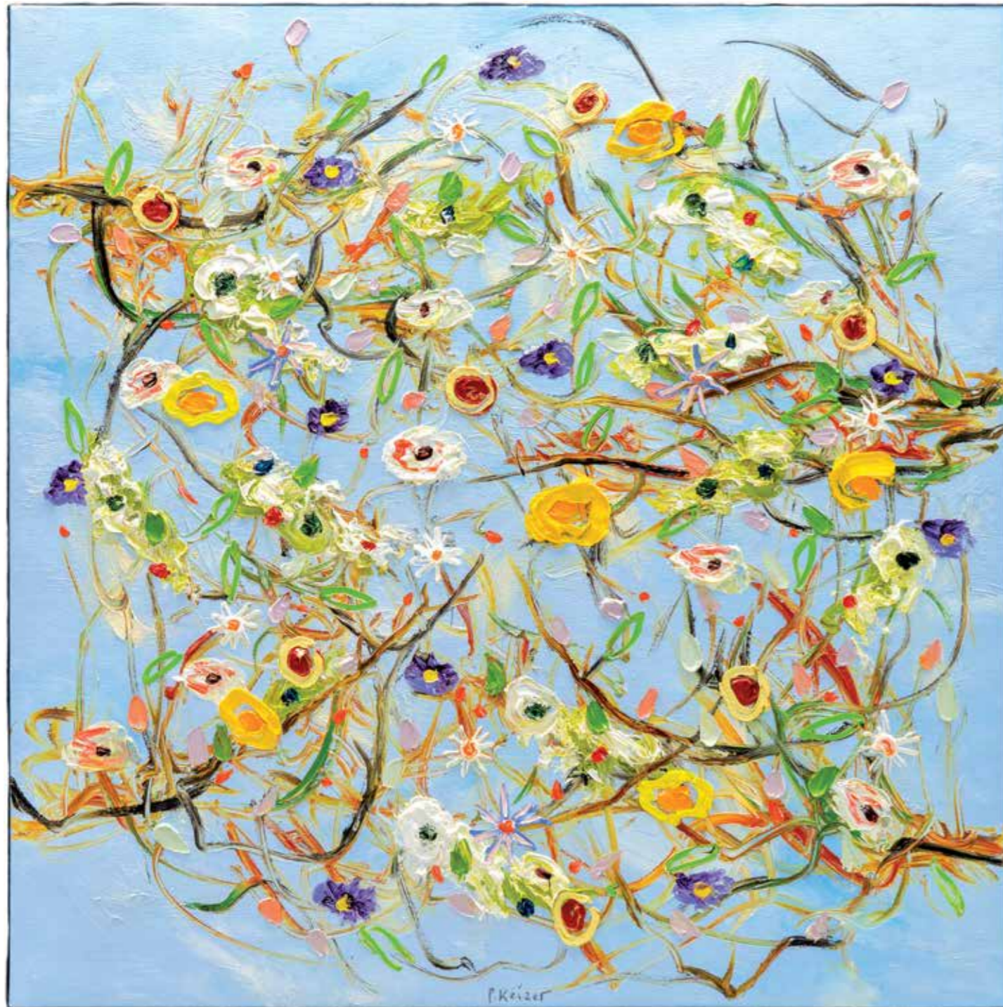
Zingend land, 2018 120 x 120 cm (private collection)