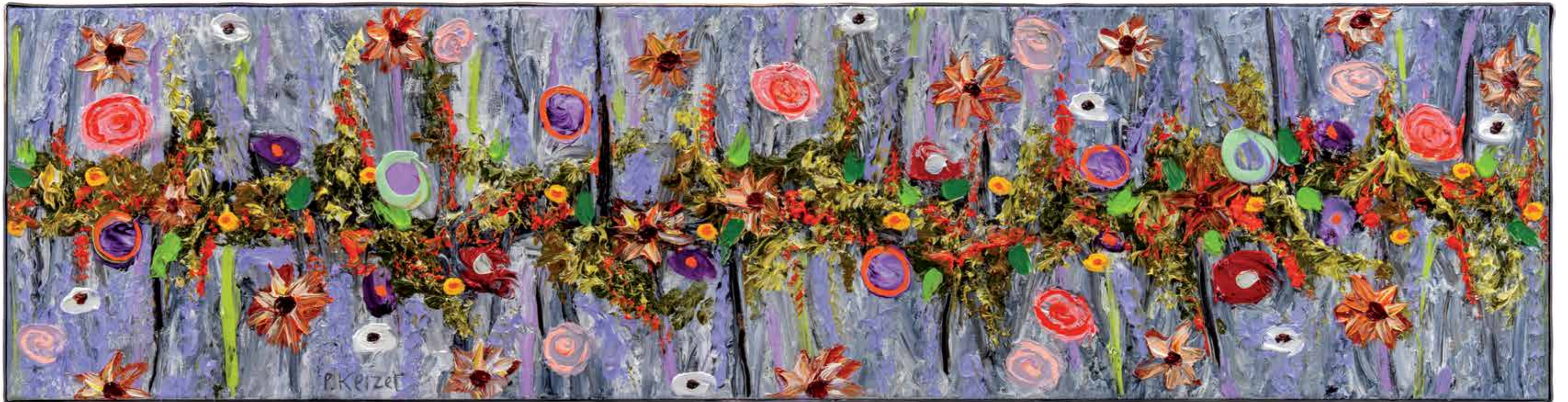
Uit mijn ritme, 2019 35 x 140 cm