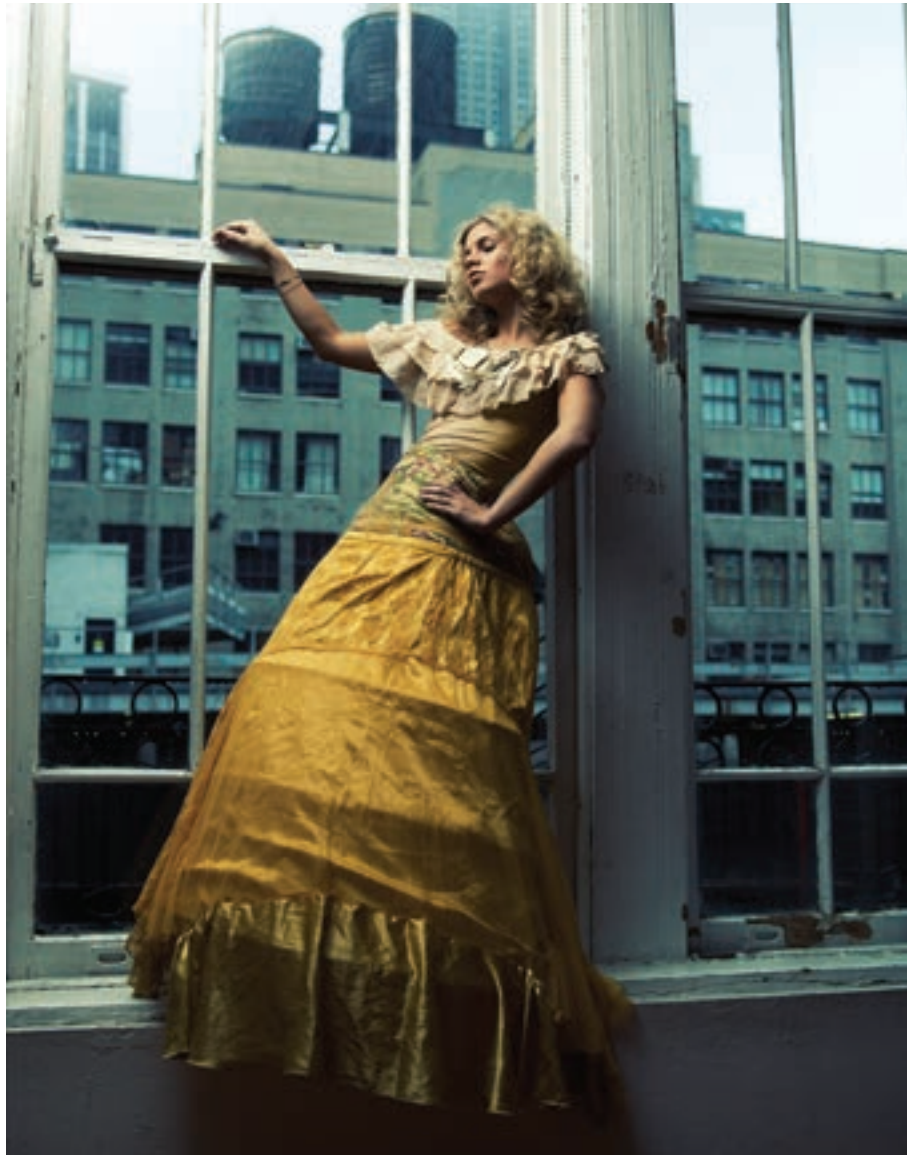
Workshop New York (Model Mayhem).

www.modelmayhem.com ). De redenen zijn simpel: deze websites zijn duidelijk gestructureerd en er zijn al veel modellen op te vinden (of andere teamleden, maar dit hoofdstuk gaat over modellen). Je vindt daardoor waarschijnlijk sneller wat je zoekt.