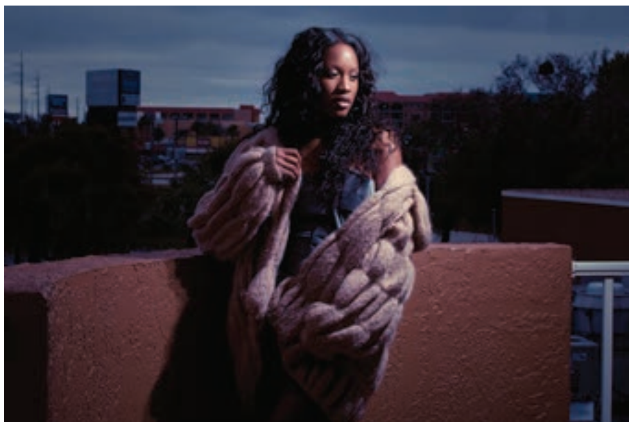
Fotoshoot Orlando (Model Mayhem).

De modellen op de website hebben niet allemaal evenveel ervaring en sommigen liegen er zelfs over. Het is ook moeilijk om een model te beoordelen aan de hand van een online portfolio. Ik heb gewerkt met modellen met fantastische online portfolio's en het leverde geweldige foto's op, die ik zelf ook mooi vond, maar om ze te maken was verschrikkelijk.