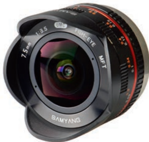
Een objectief met een korte brandpuntsafstand heeft per definitie een grote beeldhoek. Dat brengt een kenmerkende vertekening met zich mee, maar dat is voor 360°-fotografie geen probleem.

De kunst van sferische 360°-fotografie is om net zo lang foto's te maken van de omgeving totdat je letterlijk alle hoeken hebt vastgelegd. Het aantal foto's dat je nodig hebt is afhankelijk van de brandpuntsafstand van de lens die je gebruikt. Bij een hele korte brandpuntsafstand spreken we over een fisheyeobjectief. Zo'n lens heeft een grote beeldhoek en legt daardoor van zichzelf al een groot deel van de omgeving vast. Dat betekent dat je niet zo heel veel foto's nodig hebt om alles om je heen vast te leggen. Als je 360°-foto's gaat maken met een gewone fotocamera dan is het daarom handig om te investeren in een fisheylens.