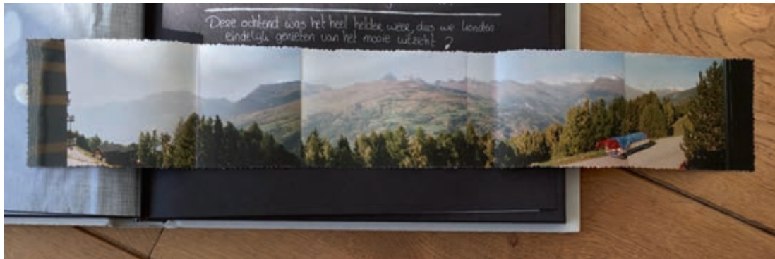
Een knip-en-plak panorama uit het analoge tijdperk. Zelden kreeg je de foto's qua belichting goed op elkaar afgestemd, en het bleef behelpen met het inpassen van het resultaat in je plakboek.

Kom je net als ik uit het tijdperk van de analoge fororolletjes? Dan heb je vast ook wel eens getracht om tijdens de vakantie een mooi panorama vast te leggen door meerdere foto's te maken en achteraf de foto's aan elkaar te plakken, in een poging de weidsheid van het landschap in de vorm van een tastbare herinnering te bewaren. Tien tegen één dat de uiteindelijke foto toch tegenviel: de overgangen tussen de foto's waren niet helemaal goed, of de belichting week per foto af. Bovendien bleek het vakantieplakboek helemaal niet zo geschikt voor het inplakken van zo'n panorama.