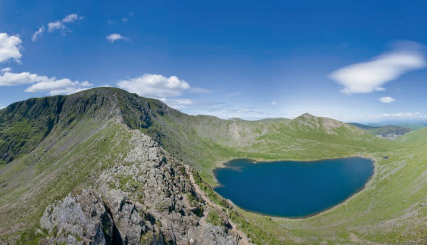
Een 'traditionele' 360°-foto in cilindrische projectie waarbij je wel om je heen, maar niet naar boven of naar beneden kunt kijken.