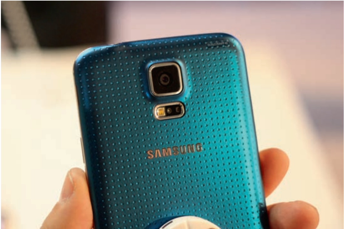
Een moderne smartphonecamera kan digitale foto's van zeer hoge kwaliteit maken.

hoogwaardige foto's gemaakt kunnen worden, met een hoge resolutie en natuurgetrouwe kleurweergave.