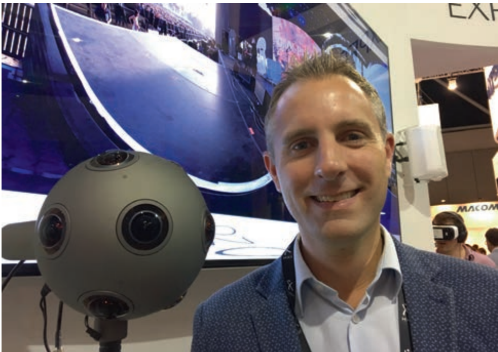
De auteur van dit boek, op de foto met een Nokia Ozo 360°-camera.