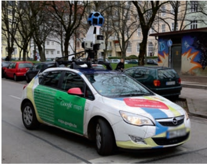
Voor het maken van de 360°-foto's die je kent van Google Streetview maakt Google gebruik van auto's met daarop speciale camera's, die om de paar meter een 360°-opname van de omgeving maken.

De kunst van sferische 360°-fotografie is om net zo lang foto's te maken van de omgeving totdat je letterlijk alle hoeken hebt vastgelegd. Het aantal foto's dat je nodig hebt is afhankelijk van de brandpuntsafstand van de lens die je gebruikt. Bij een hele korte brandpuntsafstand spreken we over een fisheyeobjectief. Zo'n lens heeft een grote beeldhoek en legt daardoor van zichzelf al een groot deel van de omgeving vast. Dat betekent dat je niet zo heel veel foto's nodig hebt om alles om je heen vast te leggen. Als je 360°-foto's gaat maken met een gewone fotocamera dan is het daarom handig om te investeren in een fisheylens.