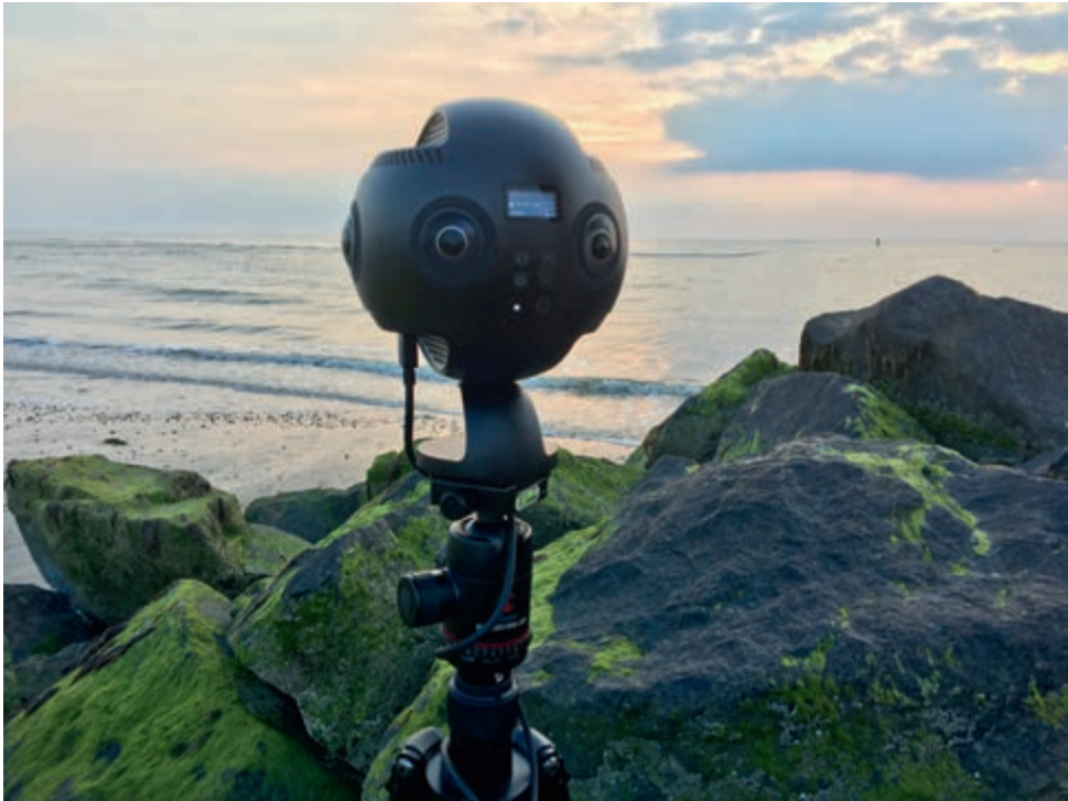
Opgnamen maken op het strand van Texel met een professionele 360°-videocamera.