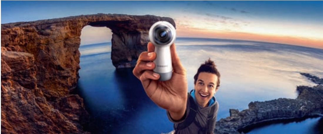
360°-fotografie en -video komt binnen ieders handbereik dankzij betaalbare 360°-camera's.

Het goede nieuws is dat je geen vermogen hoeft uit te geven aan nieuwe apparatuur. Waarschijnlijk kun je met je huidige camera of smartphone heel wat meer dan je denkt, zeker als het gaat om het maken van 360°-foto's. Maar natuurlijk is er ook allerlei specialistische apparatuur op de markt, variërend van instamodel 360°-actiecamera's tot en met professionele 360°-opnameapparatuur die vele duizenden euro's kost. Begin gewoon met een 360°-foto/videocamera van een paar honderd euro of een speciale panoramische statiefkop – kortweg panoramakop – voor je huidige camera en als de techniek je bevalt kun je altijd upgraden naar een duurder systeem.