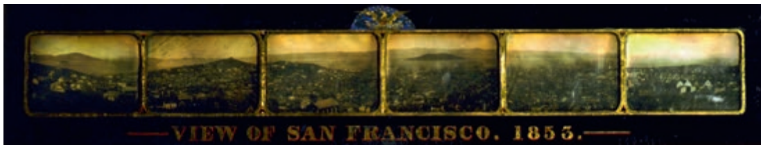
Een zeer vroege analoge panoramafoto van San Francisco (1853).

Toen ik wat ouder werd en voor het eerst in aanraking kwam met video bleek het ook met de camcorder lastig om mooie landschappen en imposante gebouwen in hun volle glorie vast te leggen. Alhoewel video als medium prima geschikt is om in een paar shots zowel de grootsheid van een locatie als de kleine details vast te leggen, lukt het zelden om de kijker echt het gevoel te geven daadwerkelijk op die plek te zijn; daarvoor is gewone videoregistratie te afstandelijk.