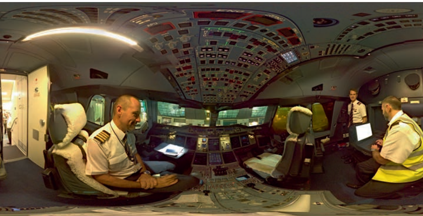
In deze 360°-foto die ik in Dubai maakte van de cockpit van een Airbus A380 kun je niet alleen om je heen, maar ook boven en onder je kijken. Helaas leent het papier van dit boek zich niet voor een interactieve weergave. Bekijk de 360°-foto hier: 360shooter.nl/cockpit .