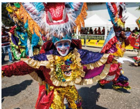
Het carnaval van Barranquilla.

Wandeltochten maken. Het nationale park Los Nevados in Centraal-Colombia biedt enkele van de mooiste trektochten in dit deel van de wereld. Zie blz. 175-177. Dansen. U bent niet echt in Colombia geweest als u nog nooit een salsoteca hebt bezocht. Die in Cali zijn wereldberoemd. Zie blz. 88-89.