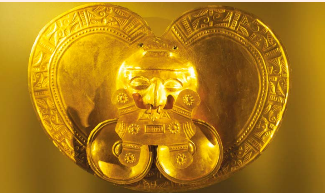
Een gouden borsthanger van de Calima in het Museo del Oro in Bogotá.

in hun gemeenschappen, aangezien hun werk als heilig werd gezien. Edelsmeden bekleedden vaak een hoog politiek ambt of waren zelfs religieuze leiders. De edelmetalen werden in de regel gedolven in alluviale velden en vervolgens gesmolten in de aardewerken smeltkroezen van geïmproviseerde, met houtskool gestookte ovens, die op heuveltop-