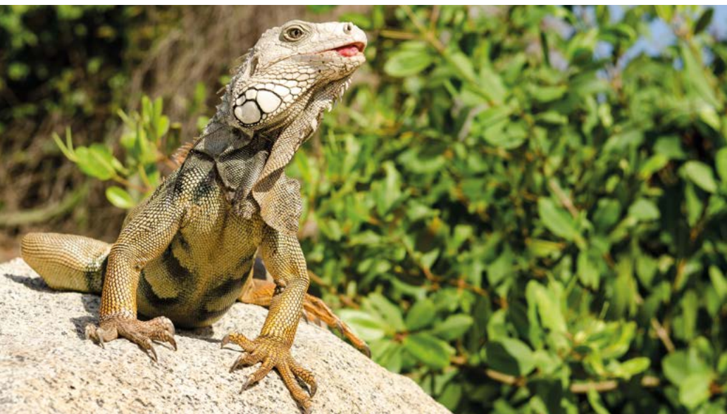
Groene leguaan in het Parque Nacional Natural Tayrona.

van zeer uiteenlopende soorten zonder meer waarmaken. Aan de Caribische kust komt u dieren tegen die al net zo uniek zijn als de cultuur. Een van de meest karakteristieke is de leguaan. Ze zitten overal, hoewel u zich buiten de stedelijke gebieden moet begeven als u ze in hun natuurlijk habitat wilt observeren. Meestal scharrelen ze rond in bomen op zoek naar vruchten, maar u kunt ze ook in een schommelgangetje de weg zien oversteken. Op het terrein van de Quinta de San Pedro Alejandrino in Santa Marta zult u er beslist veel zien. En mocht u Johnny