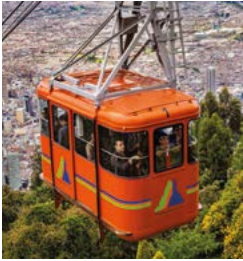
Kabelbaan naar de Monserrate.

Een gedetailleerde gids van het hele land, waarbij de belangrijkste bestemmingen met een cijfer (of letter) zijn aangegeven op de kaartjes (bijvoorbeeld 1 ).