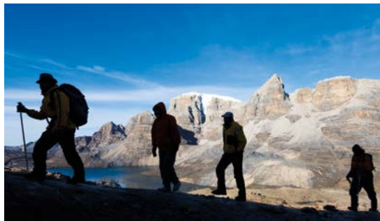
Op trektocht in het Parque Nacional Natural El Cocuy.

De golfslag aan de zuidkant is perfect voor liefhebbers van body-surfen. Zie blz. 231. Palomino. Bij een klein plaatsje in het departement La Guajira ligt een van de mooiste stranden van het land. Wees wel bedacht op de sterke stroming. Zie blz. 222. Playa Blanca. Dit witte zandstrand, misschien wel het bekendste van Colombia, ligt op slechts drie kwartier varen van de koloniale parel Cartagena. Zie blz. 191.