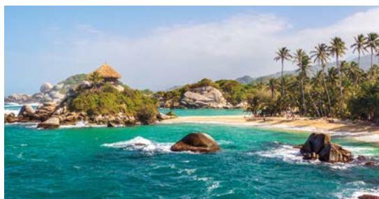
Cabo San Juan de Guía.

Fiesta de San Pacho. In september smelten het katholieke geloof en Afro-Colombiaanse tradities in Quibdó (Chocó) samen tot een festival van een maand, met optochten, straatfeesten en veel eten en drinken. Zie blz. 259.