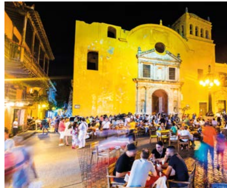
Plaza Santo Domingo, Cartagena.

Dit zijn nog maar enkele van de talloze mogelijkheden die zich hier voordoen. Als u Colombia de rest van uw leven zou doorkruisen, dan nog zou u slechts een fractie te zien krijgen van dit land, waar fantasie werkelijkheid wordt. Maar al zal het u waarschijnlijk niet lukken Colombia in alle aspecten te doorgronden, wat is er nu leuker dan een poging te wagen?