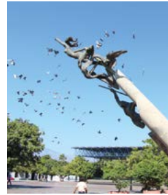
Het beeld La revolución en marcha .

De koloniale Iglesia de la Inmaculada Concepción B (Kerk van de Onbe-