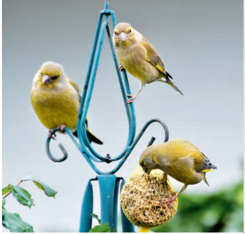
Groenlingen eten lekker van een mezenbol.