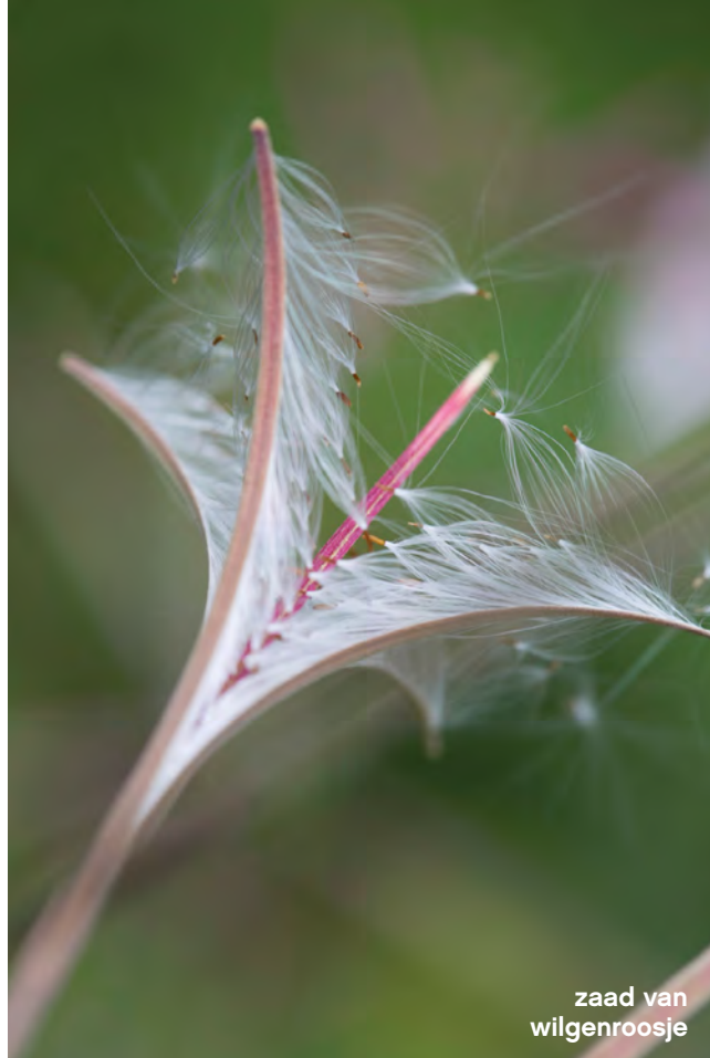
zaad van wilgenroosje

Borders krijgen extra kleur van een- en tweejarige planten en zomerbollen/-knollen. Vanaf maart kun je binnen al zaaien in bakjes. Zomerknollen zoals dahlia's plant ik begin april in potten met verse potgrond, op een warme plek gaan ze al uitlopen. Door ze zo voor te trekken, zullen ze eerder gaan bloeien. Na afharden (wennen aan de buitentemperatuur) kunnen zaailingen en voorgetrokken planten uitgeplant worden in de volle grond.