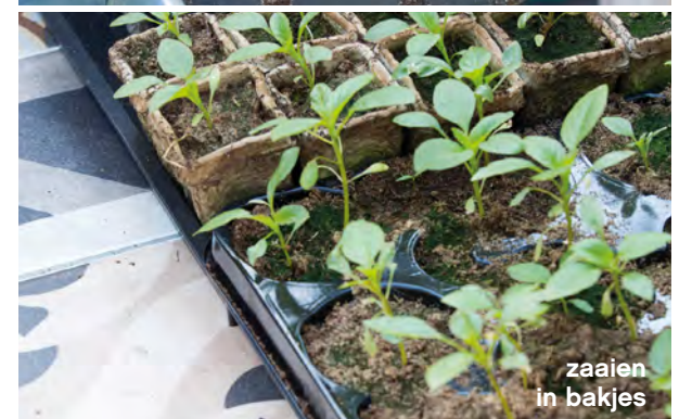
zaaien in bakjes