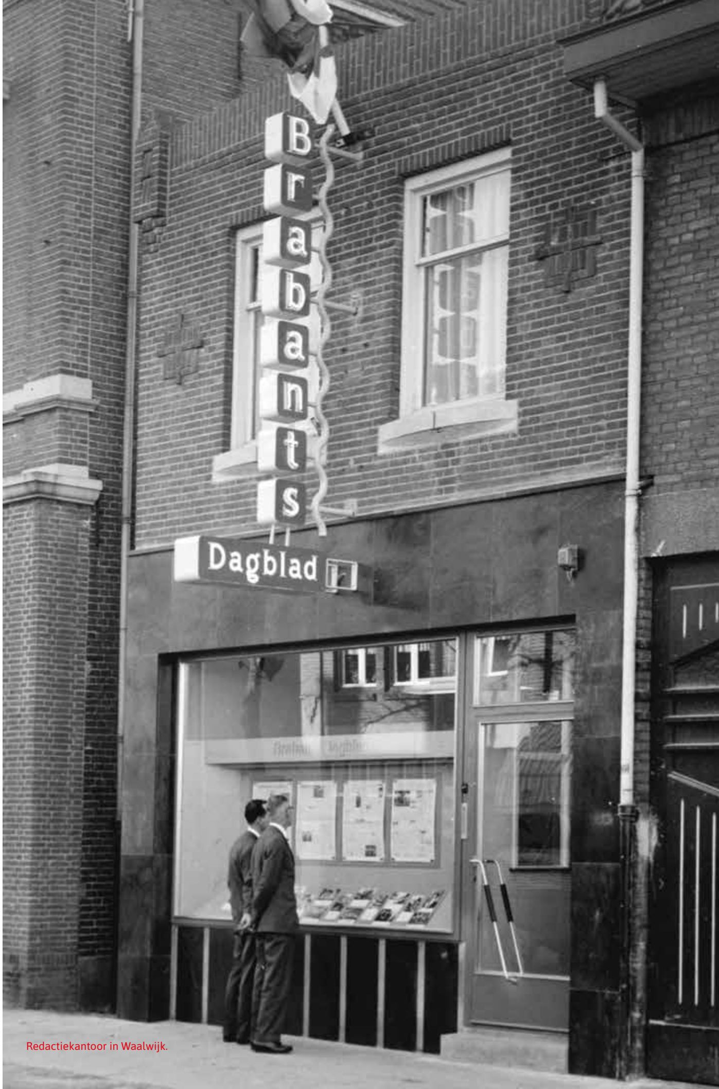
Redactiekantoor in Waalwijk.