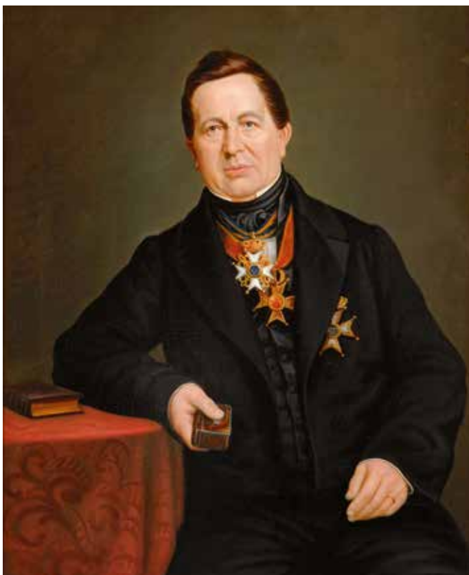
J.B. van Son (1804-1875), geboren in Den Bosch, advocaat, officier van justitie, Kamerlid en minister van R.K. Eredienst. Hij zette zich sterk in voor de emancipatie van de katholieken, ook met artikelen in de Noord-Brabander .

en onderwijs openlijk ter discussie werd gesteld, meldde hij in een ingezonden brief. Beschamende stukken die de gemeoederen ophitsen, luidde het oordeel. (Katholiek) Brabant moest het hoofd bieden aan deze kritiek van protestantse zijde door de rijen te sluiten en alert te blijven: 'Waak derhalve, Noord-Brabant waak.' [2]