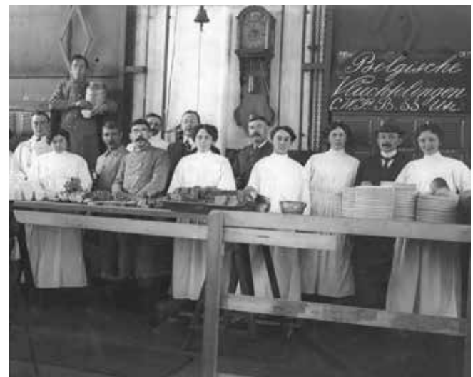
Opvang van Belgische vluchtelingen in de centrale spoorwegwerkplaats aan de 2e Daalsedijk, 1914.