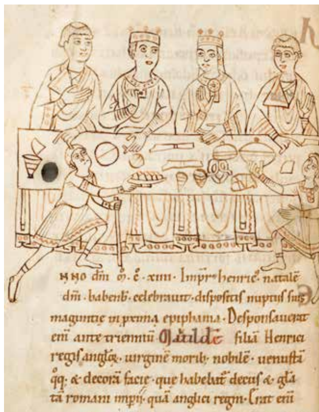
Bruiloft van Hendrik V en Mathilda in Mainz. Miniatuur uit de Kroniek van Ekkehard van Aura, circa 1114. Corpus Christi College, Cambridge

In april 1125 werd Hendrik V, nog geen 40 jaar oud, in zijn paleis in Aken door ziekte gevelde. De keizer wist dat hij niet lang meer zou leven en besloot naar Utrecht te vertrekken. Samen met Mathilda reisde hij per schip over de Rijn, om kort voor Pinksteren in Utrecht te arriveren. Op 21 mei, vijf dagen na Pinksteren, overleed hij. Zijn hart en ingewanden werden bijgezet in de keizerstombe in de Utrechtse Dom. Zijn lichaam ging per schip over de Rijn naar Speyer, naar de grafkerk van zijn voorouders. Onderweg al regelde Mathilda in een oorkonde de nagedachtenis van haar overleden echtgenoot. Dag en nacht moesten er kaarsen worden gebrand bij de tombe in de Dom. Bovendien moesten de Utrechtse kanunniken op de sterfdag van de keizer aalmoezen uitdelen aan de armen.