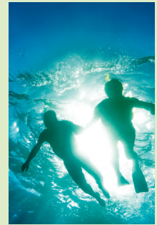
Snorkelparadijs Playa de la Veta.

Tot slot staat een bezoek aan een eenzaam zandstrand op het programma, gewoonlijk het Playa de la Veta 3 , waar je heerlijk kunt zwemmen en snorkelen.