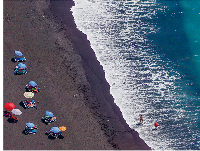
Het zwarte lavastrand van Los Cancajos is beschermd tegen stroming en branding en daarom ideaal voor gezinnen met kinderen.

Een romantische kustweg loopt van het zuidende van het strand langs het toeristenbureau verder naar het zuiden. Er zijn hier en daar bankjes neergezet, vanwaar je kunt genieten van het uitzicht op zee en de golven die rond de rotsen kolken. In de zomer zijn er