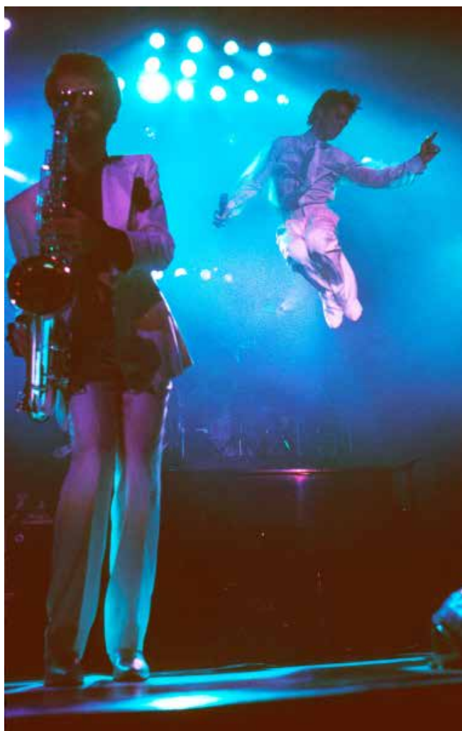
Eric Leeds en in de lucht springende Prince op het podium van de Wembley Arena in Londen, augustus 1986.