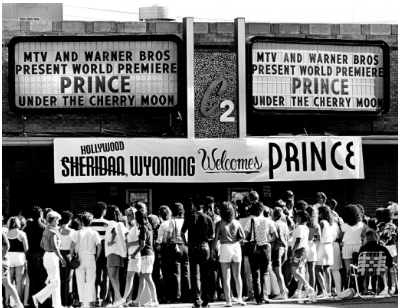
Fans die een glimp van hun idool hopen op te vangen tijdens de première van Under The Cherry Moon in Sheridan, 3 juli 1986.