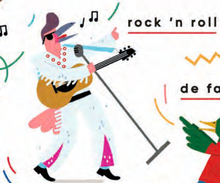
rock 'n roll