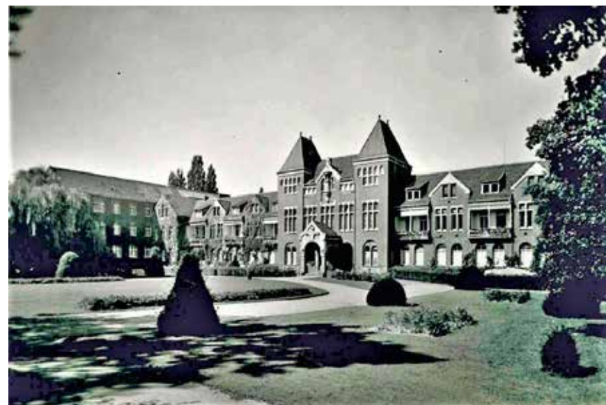
▲ Ondanks het bescheiden inkomen van de familie schuwen de ouders van Joseph kosten noch moeite om de klompvoet van hun zoon zo goed mogelijk te laten behandelen. Maar zelfs een dure operatie in het Maria Hilf ziekenhuis (zie foto) in het nabijgelegen Mönchengladbach in 1907 mag niet baten. De bijna tienjarige Joseph zal de rest van zijn leven moeten leren leven met een klompvoet inclusief metalen beugel.

► In zijn jonge jaren is Goebbels vaak te vinden in het park van het kasteel van Rheydt. Bij zijn benoeming in 1933 tot ereburger van de stad Rheydt wordt het kasteel aan Goebbels ter beschikking gesteld. In de jaren 1939-1941 wordt het onder leiding van de bekende architect Emil Fahrenkamp voor veel geld verbouwd. Ereburger Goebbels krijgt op de eerste verdieping de beschikking over diverse woon- en slaapkamers voor hemzelf en zijn gasten. Een bibliotheek vol kostbare boeken ontbreekt evenmin. Op de begane grond worden meerdere representatieve stijlkamers ingericht. Tegenwoordig is het kasteel een museum, met in de kelder een documentatieafdeling over de jaren van het Derde Rijk.