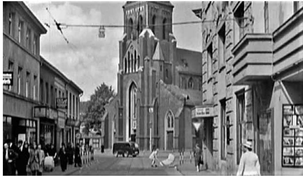
▲ Het industriestadje Rheydt, waar Joseph Goebbels in 1897 wordt geboren. Op de achtergrond de kerk die het gezin wekelijks bezoekt. Foto uit de jaren dertig.