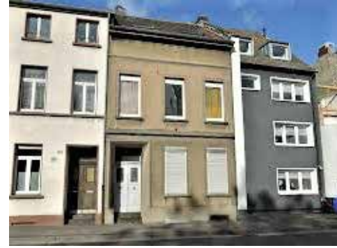
▲ Het eenvoudige rijtjeshuis in de Dahleener Straße 156 te Rheydt (gemeente Mönchengladbach) waarin Joseph Goebbels opgroeit. Tot ver in zijn volwassen jaren is dit zijn ware 'thuis', waar met name zijn moeder altijd een bemoedigend en luisterend oor voor hem heeft. De kamer onder het schuine dak is het domein van Joseph en een veilig toevluchtsoord voor de boze buitenwereld. Het is een wonder dat het huis er nog altijd staat, aangezien geallieerde bombardementen tijdens de Tweede Wereldoorlog meer dan 80 procent van Rheydt zullen verwoesten.