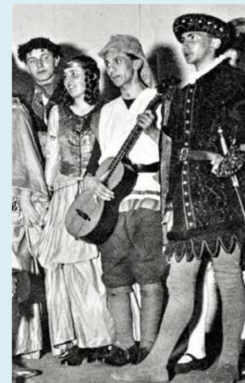
◀ Op het gymnasium blinkt Joseph uit door ijver en goede cijfers voor bijna alle vakken. Zijn fysieke zwakte compenseert hij door zijn medescholieren intellectueel af te troeven. Eerzucht en alles beter weten dan anderen zullen hem zijn leven lang blijven begeleiden. Vanwege zijn ijver en eerzucht is hij niet populair bij zijn klasgenoten, die hem vaak buitensluiten. Dat maakt dat Joseph zijn scherpe intellect nog meer als wapen gaat inzetten. Op de foto Goebbels als minstreel tijdens een uitvoering van het schooltoneel (1914).