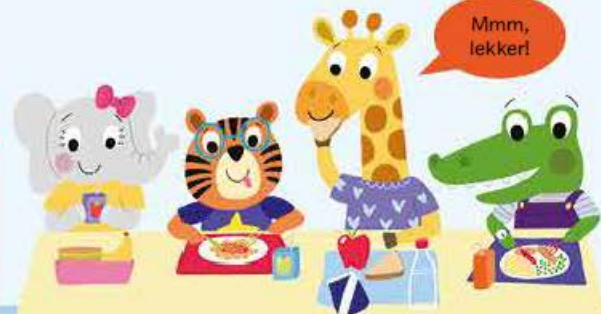
De vrienden eten samen in de eetzaal.

Beweeg de kleine wijzer naar de 12 en de grote wijzer naar de 12.