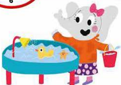
Ona speelt aan de watertafel.

Beweeg de kleine wijzer naar de 10 en de grote wijzer naar de 12.