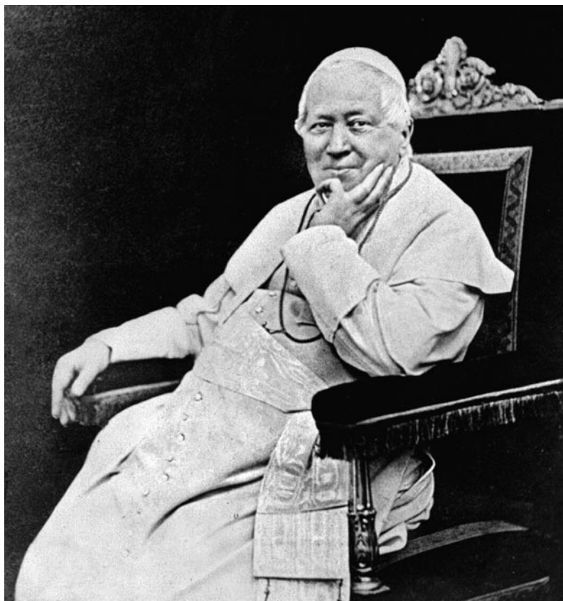
Staatsieportret van Paus Pius IX (r. 1846-1878) rond 1865.

het degelijke bestuur van zijn bisschopsdom Imola door sommigen als een kandidaat voor het pausschap werd gezien, gold aartsbisschop Mastai-Ferretti bij de dood van paus Gregorius XVI niet bepaald als een echte kanshebber voor de pauselijke tiara.