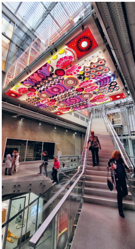
Exterieur en interieur van het Depot

gebouw tegenover het einde van de Jongkindstraat, met de kenmerkende toren met groen uitgeslagen punt erop. De enorme glimmende pot met groen op het dak rechts is het DEPOT BOIJMANS VAN BEUNINGEN , het kunstdepot van het Boijmans. Het heeft de eer het eerste voor het publiek toegankelijke kunstdepot ter wereld te zijn, wat weer te maken heeft met de ingrijpende verbouwing die het Boijmans tot waarschijnlijk 2029 ondergaat en met de lekkende kelders waarin het depot eerst was ondergebracht.