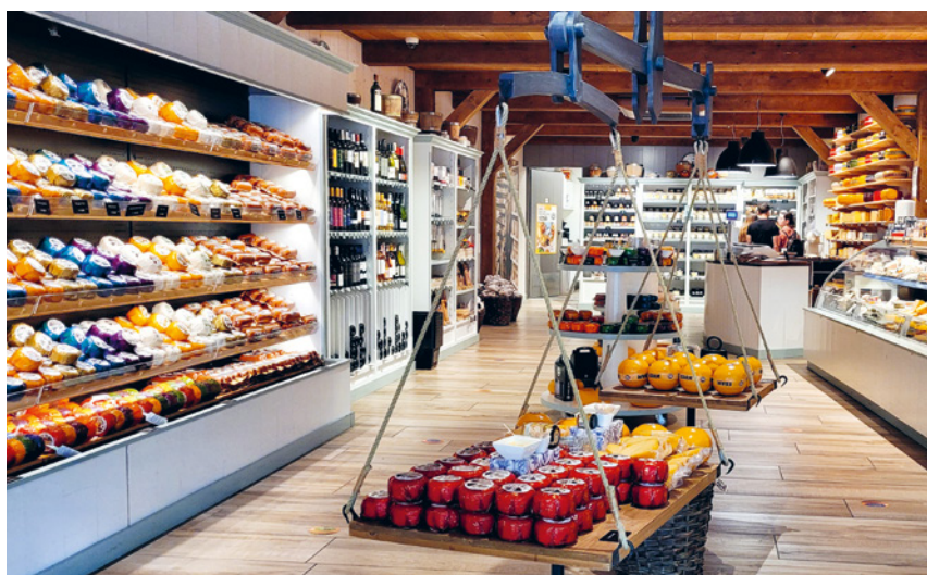
De kaasspeciaalzaak in het centrum van Edam