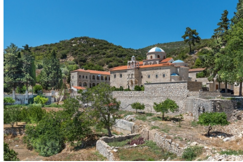
Moní Timíou Stavrou