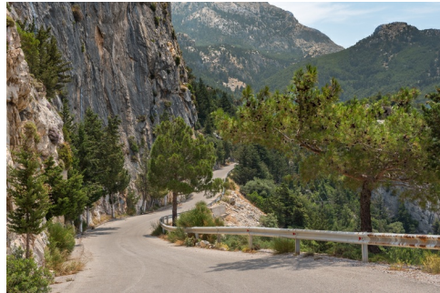
De weg tussen Drakéi en Kallithéa