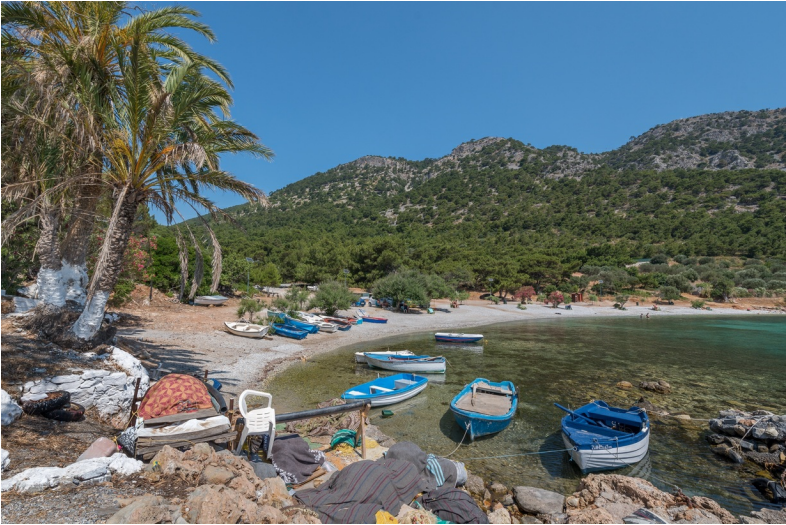
Het kiezelstrand bij Mouriá ligt in de luwte van de bergen

De streek ten oosten van Sámos-stad vormt een uitstekend wandelgebied met rustige wegen, groene dalen en bovenal een ruige kust. De twee kloosters gewijd aan de H. Maagd Maria – Zoodóchos Pigís en Ág. Zóni – zijn vanuit de stad goed te bewandelen. Daar vlakbij ligt het strandje van Mouriá met vissersbootjes en sinds kort ook een kantina (foodtruck) met stoeltjes en parasols. Ág. Paraskeví, Posidónio, Klíma en Psilí Ámmos zijn vriendelijke badplaatsen met tavernen, die in de zomermaanden druk worden bezocht. Naar de laatste twee plaatsen rijden in de zomermaanden ook bussen.