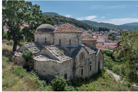
De 18de-eeuwse Ág. Giannákiskerk in de oude bovenstad

Het dorp is vanaf de benedenstad niet gemakkelijk te vinden. Aan de rondweg boven staat op een onhandige plek een bordje 'Vathí'. Het is misschien het gemakkelijkst een taxi te nemen aan de boulevard die je voor ca. vijf euro naar boven brengt. Vanaf daar hoeft je alleen maar af te dalen en te genieten van de uitzichten op de baai en de stille straatjes.