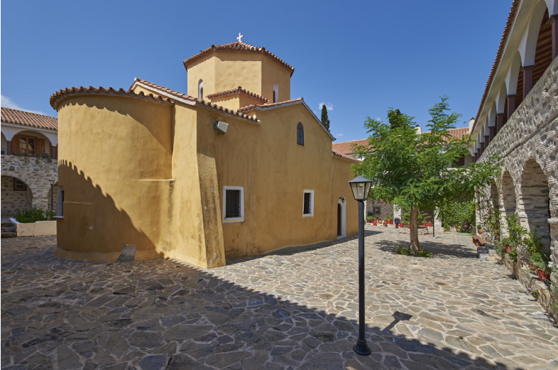
Moní Zóni ligt op de groene Vlamári-hoogvlakte

laatste monnik overlijdt of vertrekt. Rechts van het klooster ligt een vervallen kleine kloosterbegraafplaats. De doorgaande weg sluit aan op de weg van Sámos naar Paleókaastro, Kérveli, Posidónio en Klíma.