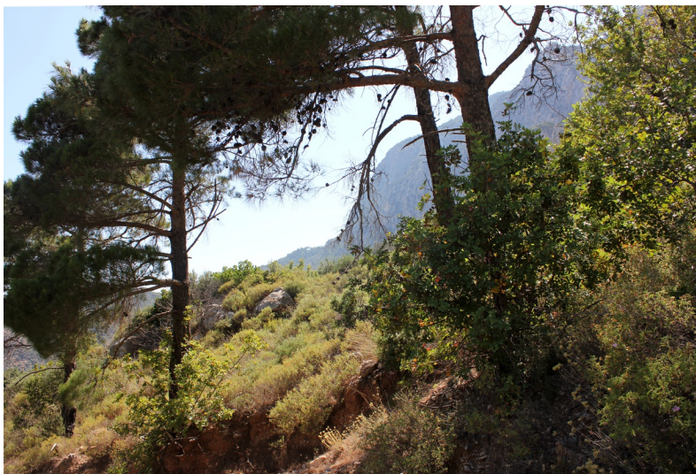
Het woeste binnenland van Sámos.

Het landschap van Sámos wordt door twee bergmassieven bepaald. In het westen rijst het Kerketéfs-gebergte (ook wel Kérkis ) op met als hoogste top de Vígla (1433 m). Het gebergte is rijk aan grotten. In het midden ligt het Ámbelosgebergte met de Karvoúni (1153 m) als hoogste top. Tussen de bergketens en de zee strekken zich kleine, vruchtbare vlaktes uit, waarvan de Kámboš Chóras bij Pithagório de grootste is. Het is dan ook niet voor niets dat de luchthaven van het eiland zich daar bevindt. De zeestraat, Stenó Samoú, die het eiland van Turkije scheidt, is op het smalste punt bij Psíli Ámos slechts 1200 meter breed.